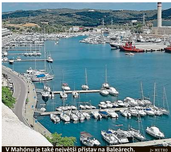
V Mahónu je také největší přístav na Baleárech.

Zatímco její město dlouhá léta žilo pod nadvládou Maurů a odolávalo napadení Turků, hlavní město Mahón bylo součástí Byzantské říše, než jej ve 13. století připojil Alfons Aragonský do Mallorského království a poté si jej oblíbili Britové, kteří z něj právě udělali hlavní město. Také se zde nachází velký přístav a záliv, po kterém se můžete projet lodí. IVETA BENÁKOVÁ