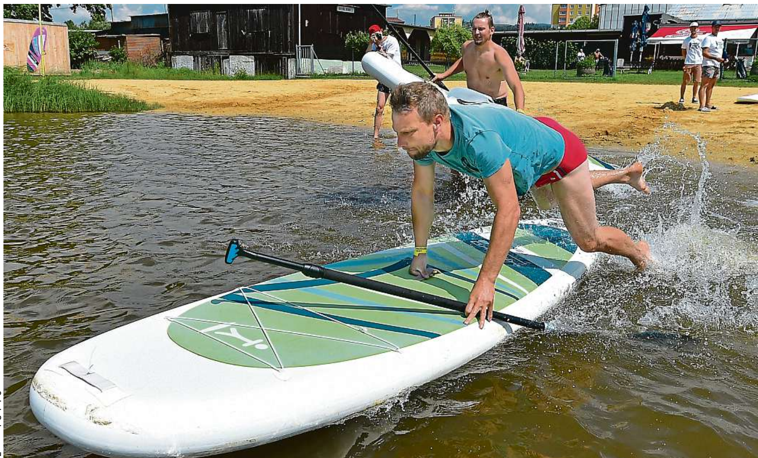
Paddleboard fest přilákal k rybníku v Nové Roli na Karlovarsku stovky lidí. Součástí akce byl závod v paddleboardingu. Zájemci si tento sport mohli i vyzkoušet.

Satality. Hlavně vesnice kolem Prahy mají problém. Obecní kasa. Chybí v ní peníze, obyvatelé mají totiž trvalý pobyt hlášený jinde a starosta tak nedostává příspěvky „za hlavu“, ročně to dělá několik tisíc STRANA 2