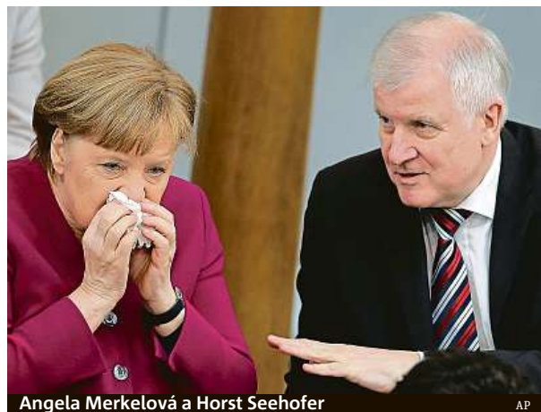
Angela Merkelová a Horst Seehofer

„Už s tou ženou nemůžu pracovat,“ řekl podle Welt am Sonntag Seehofer ve čtvrtek hned dvakrát na schůzce se členy vlády za jeho CSU. Jeho nezvyklá slova odrážejí vyhrocenou situaci mezi ním a Merkelovou, o jejímž možném konci už začínají speku-