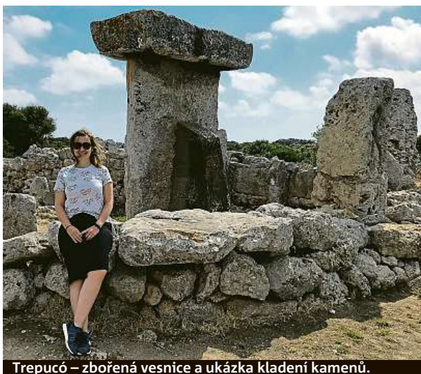
Trepucó – zbořená vesnice a ukázka kladení kamenů.

A jak si krásy ostrova nejlépe prohlédnout? Hned na letišti je k vidění místní turistická agentura. Ta nabízí jak vý-