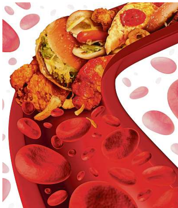
Cholesterol je i dobrý, záleží na jeho zdroji.