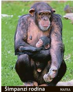
Šimpanzí rodina

New York Times, který přinesl příběh zvířecí „influencerky“, 18leté šimpanzice Julie. Ta si z ničeho nic začala do uší zastrkávat dlouhá, tvrdá stébla trávy, a pak s tímto novým doplňkem celý den chodila kolem, uvedl v reportáži seriózní americký deník, který doplnil, že ostatní šimpanzi z přírodní rezervace Chimfunshi v Zambii byli doslova okouzlení a brzy to začali zkoušet i další. Nejdřív Juliin syn, pak dvě nejbližší kamarádky, pak přítel, až se nakonec osm šimpanzů z desetičlenné skupiny snažilo před zraky influencerky Julie –