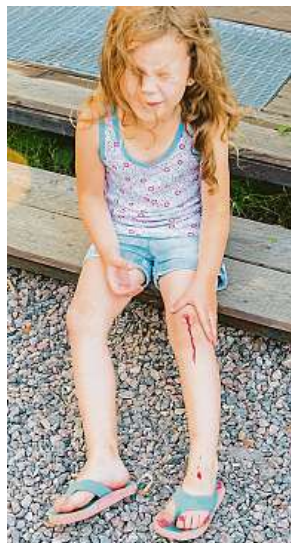
Rozbité koleno

Počasí venku doslova volá po venkovních aktivitách. A s nimi se pojí nejen radost z pohybu, ale i občasné zranění, od běžných odřenin až po vážnější úrazy.