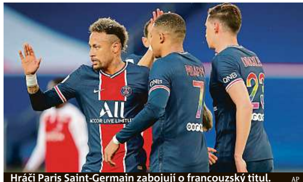
Hráči Paris Saint-Germain zabojují o francouzský titul.

La Liga vyvrcholí o víkendu. Tabulku vede Atlético Madrid o dva body před svým městským rivalem Realem. V sobotu od 18 hodin bude právě Bílý balet, který titul obhajuje, hostit Villarreal. Ten ještě bojuje o pohárové příčky a navíc ho příští středu čeká finále Evropské ligy. Atlético hraje na půdě Valladolidu, který se zase touží ještě zachránit. Kdo bude nakonec šťastnější?