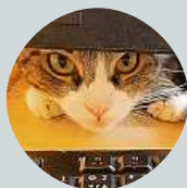
Jana Buřičová Aby mi zaklepala na rameno nějaká kontrola? To ne.