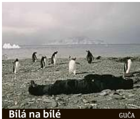
Bílá na bílé

Program projekcí v letních kinech a autokinech mohou diváci najít na stránkách festivalu jedensvet.cz.