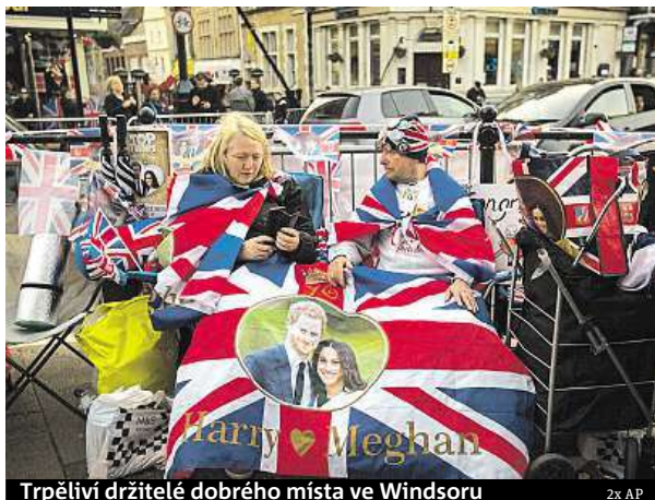
Trpěliví držitelé dobrého místa ve Windsoru

Na svatbu, jež má stát podle odhadu britských médií 1,7 milionu liber (téměř 50 milionů korun), bylo pozváno 600 hostů. Miliony lidí po celém světě budou obřad sledovat u televizních obrazovek či prostřednictvím inter-