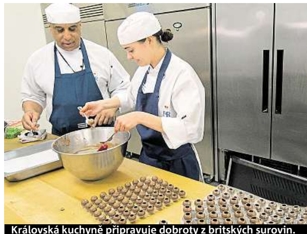
Královská kuchyně připravuje dobroty z britských surovin.

netu, i když britský tisk podotýká, že pro mnoho Britů bude ten den událostí číslo jedna spíše večerní finále fotbalového Anglického poháru. Speciální zpravodajství nebo přímý přenos z této významné společenské příležitosti i většina tuzemských médií.