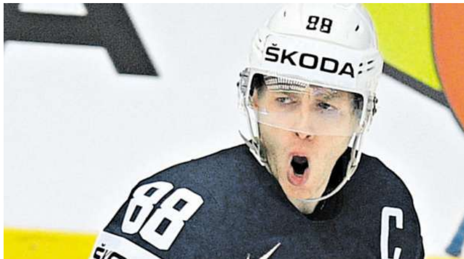
Patrick Kane z USA se raduje ze svého gólu na 3:2.