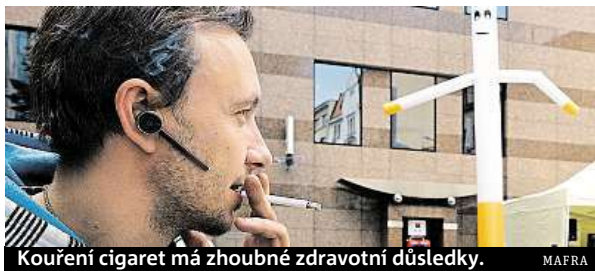
Kouření cigaret má zhoubné zdravotní důsledky.

Ještě více by kuřáci zhodnotili peníze v případě pravidelných investic. Často totiž kouří i několik desítek let, a kdyby zvolili pravidelné investice, mohli by během deseti let při investici ve výši 1800 korun a zhodnocení okolo 4 procent mít 265 050 korun, během dvaceti let už je to 660 194 korun a za třicet let při stejných podmínkách dokonce 1 249 289 korun. „Za třicet let tak silný kuřák prokouří zajištění na penzi. Kalkulovat s tím, že se důchodu kvůli možným zdravotním komplikacím ani nedožije, je