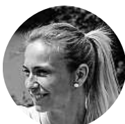
Ávina Stašina Mám dva kluky s velkým odstupem, a stačí mi to.