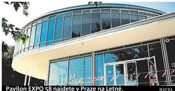
Pavilon EXPO 58 najdete v Praze na Letné.

Tenhle přetlak v kombinaci s nezájmem vrchnosti vyústil