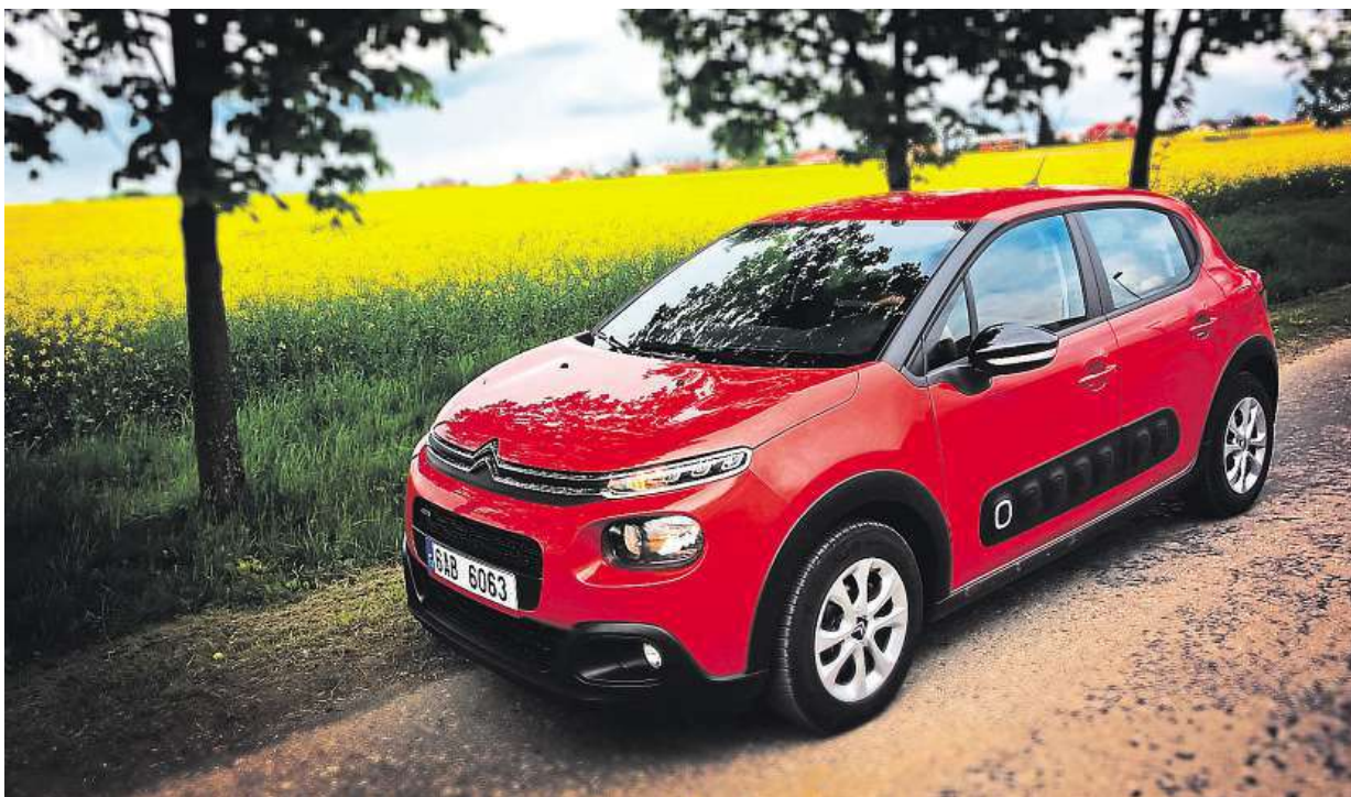
Designéři francouzských aut se nikdy nebáli.

Když to auto ukážete třicetileté ženě, bude se jí líbit neotřelý design, soulad zaoblených předních světel a mlhovek, úzký proužek denního svícení a také velikost. Pro jednoho královský prostor, pro dva ideál. Starší ženy to auto baví taky, líbí se jim vyšší posez, je to sice malý hatchback, ale připomíná SUV. A také ji zaujmou zajímavé plastové bubliny na boku, které auto chrání proti běžným odřeninám a které Citroën představil už u modelu C4 Cactus. Všechny věkové skupiny pak během našeho svezení hodnotily kladně vnitřní design. Neokázalý interiér je moderní, a přesto se brzy neokouká. Zajímavé jsou čtvercové prolisy ve dveřích, jejichž tvrdé plasty sice působí trochu lacině, ale hezky ladí s bublinami na boku, zadními světly, vnitřkem volantu nebo větráčky. Designéři francouzských aut se nikdy nebáli – a naštěstí ani u nové C3. Vždyť třeba jen poutka na zavírání dveří jsou jako od cestovního kufříku. V čem C3 exceluje, to je místo pro nohy spolujezdce vpředu. Přístrojovka je tak široce vykoupená, že může posunout sedadlo dopředu