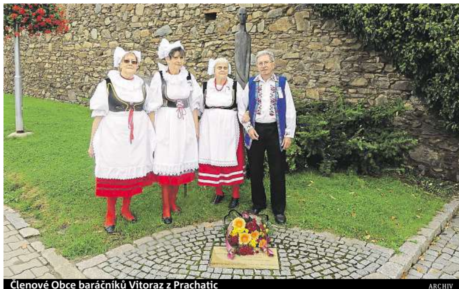
Členové Obce baráčníků Vitoraz z Prachatic

Nedašovští si již nebudou muset na každé vystoupení složitě půjčovat nástroje či