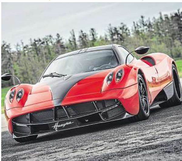
Italský supersport Pagani Huayra v barevném provedení Rosso Monza

Letošní motoristická slavnost Legendy, která se koná 10. a 11. června v areálu bohnické léčebny v Praze, představí jeden z klenotů automobilového světa, italský supersport Pagani Huayra v barevném provedení Rosso Monza. Byl vyroben ve městě San Cesario sul Panaro nedaleko italské Modeny, kde společnost Horacia Paganího od roku 1992 sídlí. Na svém výrobním štítku nese pořadové číslo 51 z celkové série 100 kusů a rok výroby 2016. Vůz, který má najeto pouze 7 kilometrů a má 730 koňů, je také vlastnoručně podepsán Horaciem Paganím. Tento exponát má svého majitele v Česku, jeho cena je 1,5 milionu eur bez daně. HOP