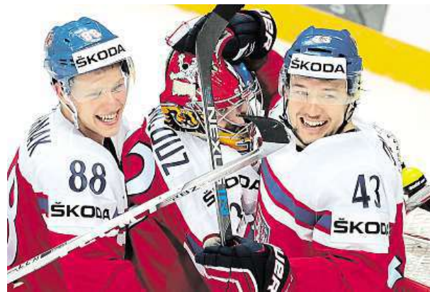
Čeští hokejisté slaví výhru nad Švýcarskem.

Čeští hokejisté zůstávají také pro čtvrtfinále v Moskvě. V něm se zítra od 15.15 hodin utkají se Spojenými státy americkými. Ve skupině prohráli pouze jednou.