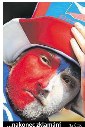
...nakonec zklamání 3x ČTK