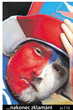
...nakonec zklamání