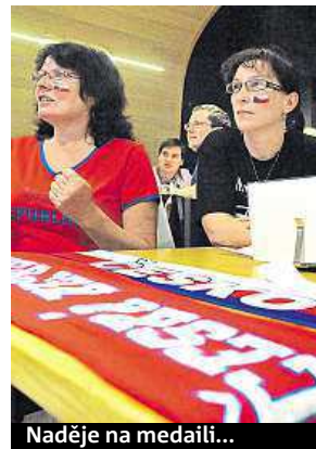
Naděje na medaili...