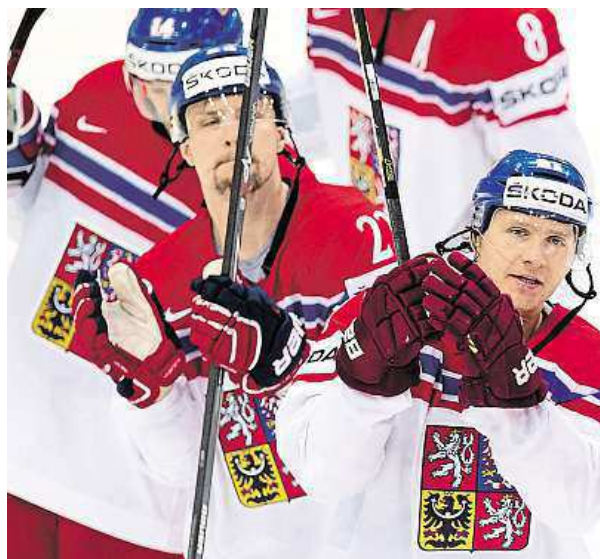
Jsou bez medaile. Přesto jim diváci tleskali vestoje.

Český tým nastoupil do svého závěrečného utkání na turnaji po semifinálové prohře s Kanadou 0:2. Zámořský celek byl velkým favoritem, což také svým velmi dobrým výkonem potvrdil. Naším hokejistům však nebyl uznán reguleční gól.