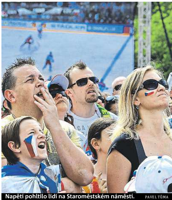
Napětí pohltilo lidi na Staroměstském náměstí.

Mnoho fanoušků ale vyrazilo také do fanzóny vedle O2 areny, která byla při českých zápasech znovu vyprodaná. Zaplněna byla i střecha nedařlé Galerie Harfa.