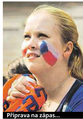
Příprava na zápas...