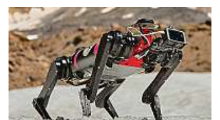
Na cizí planetě? To není díky výzkumníkům fikce. 2x LASSIE PROJECT