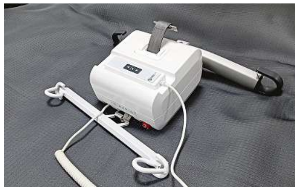
Ovladač závěsného zařízení obézního pacienta. Systém pásů umožní předávat nemocného v popruzích například na převozní lůžko.

„Byli bychom raději, kdyby se nemocnice nemusely specializovat na pacienty XXL,“ říká Martin Prázný, vedoucí lékař pro neintenzivní léčbu na III. klinice VFN. Všeobecně rostoucí váha populace u nás i ve světě však nutí, aby se trendu přizpůsobovalo i zdravotnictví. „Dříve měla lůžka nosnost do 150 kilogramů. Projevilo se to už při covidu,