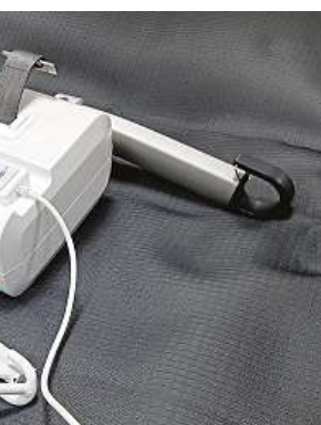
Ovladač závěsného zařízení obézního pacienta. Systém pásů umožní předávat nemocného v popruzích například na převozní lůžko.

nosností, že si je pacienti sami polohovali pomocí motorků. Jenže ta takovou zátěž nevydržela a lůžka se porouchávala. Ta nová už jsou připravená na těžší váhy,“ říká na adresu nového vybavení Prázný.