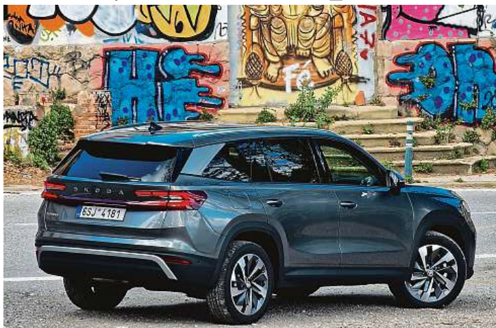
Stále jde o krále zavazadelníku. Naftový Kodiaq v pětimístném provedení odveze 910 litrů v kufru, plug-in hybridní verze „jen“ 745. Ceny auta nebyly zveřejněny.