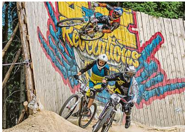
Předjížděcí manévry na závodě JBC Revelations