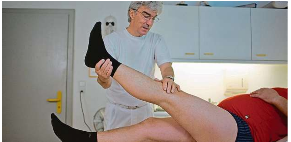
Ve světovém měřítku je lékařská péče v Česku nadstandardní a velmi přístupná. Jen ji využít.

„S chronickým selháním ledvin, srdce nebo s diabetem 2. typu se v Česku potýkají statisíce lidí. ČR, Polsko a Slovensko i 30 let po pádu železné opony stále bojují s vysokým výskytem kardiovaskulárních a metabolických onemocnění,“ prohlásil předseda Sdružení praktických lékařů Petr Šonka. I když se podle něj situace pomalu zlepšuje,