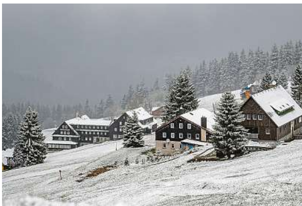
Rychlý nástup jara střídá počasí jako na konci zimy. ČTK

lik desítek centimetrů nového sněhu. Nejvíce patrně na Šumavě a v Krkonoších – možná i kolem třiceti centimetrů. V sobotu navíc bude v nejvyšších polohách během dne sněžit dál. idnes.cz a ČTK