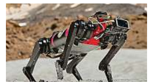
Na cizí planetě? To není díky výzkumníkům fikce. 2x LASSIE PROJECT