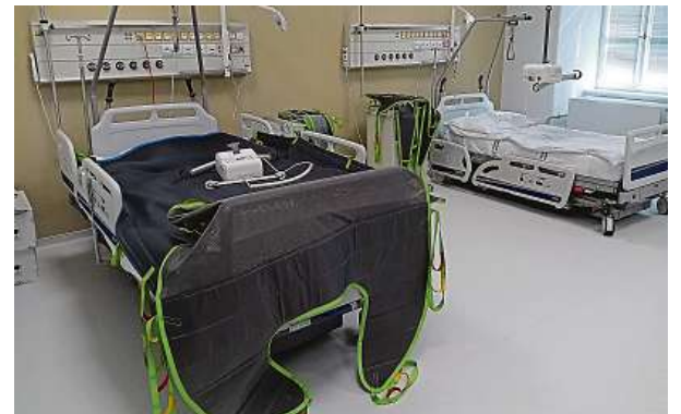
Vlevo lůžko s nosností 500 kilogramů s plachtou, do které lze zavést pacienta vážícího až 300 kilogramů. Vpravo lůžko na 200 kilogramů.

protože bylo hodně oběžních pacientů, kteří byli z hlediska té epidemie rizikovější,“ potvrzuje Prázný slova kolegyně Křížové, že na péči o oběžního nemocného bylo nutné sehnat víc personálu. „Problém byl u lůžek s malou