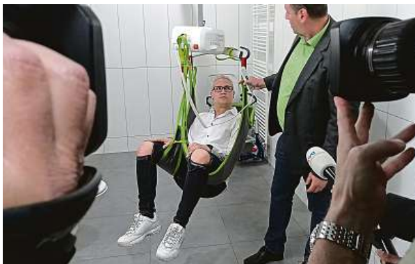
Figurant s muší váhou předvádí novinářům coby pacient o hmotnosti 200 kilogramů, jak by vypadal přesun do koupelny.

Křížová, vedoucí lékařka JIMP. Když bylo třeba zavést nemocnému katetr či ho jinak ošetřit, když se prováděla hygiena, sháněli silné paže po celé budově. „Na některé pacienty nás muselo být až deset, někdy ani to nestačilo a pacienta jsme umývali rovnou na lůžku,“ dodává Křížová a je ráda, že se teď jejím sestřičkám alespoň trochu uleví.