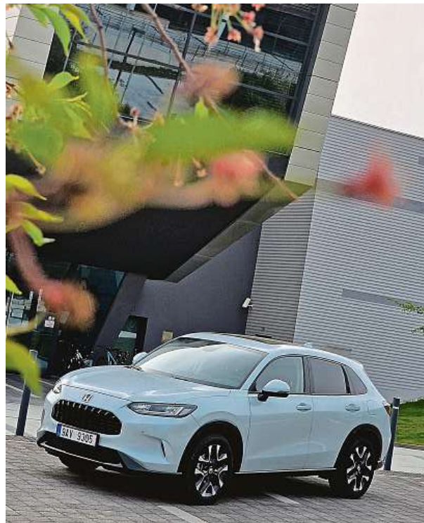
Cena modelu ZR-V startuje na 900 tisících korunách. Je to velmi efektivní hybrid s příjemnými jízdními vlastnostmi. METRO

Navíc je to velmi milé auto i řidičsky. Víceprvková náprava na zadku, dobré tlumiče vpředu. Pohodlné, dobře sedící a zábavné. PETR HOLEČEK