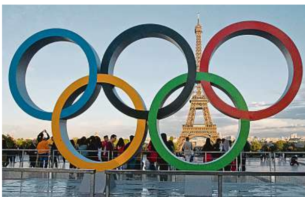
Paříž, kde se olympijské hry od 26. července do 11. srpna uskuteční, zahájila intenzivní přípravu. Více si přečtete na straně 3.

Většina z odhadovaných medailistů (najdete je v boxu) si už místo vybojovala, ať už přímo na jméno, nebo na kvótu. Další sportovci by až do začátku července měli přibývat z kvalifikací. Z kolektivních sportů drží naději už pouze ragbisty. Celkově mají Češi