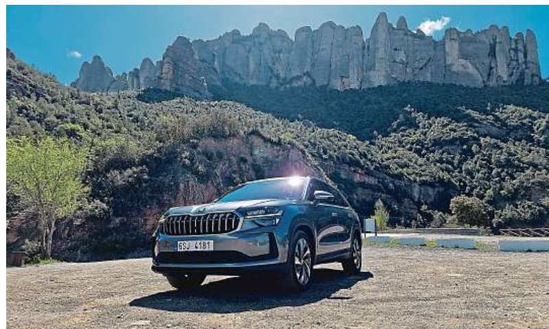
Nad námi se ukrývá Montserrat – benediktinský klášter na stejnojmenné hoře asi čtyřicet kilometrů severozápadně od Barcelony, významné poutní místo Katalánska. 2x METRO

Druhou generaci velkého SUV Škoda Kodiaq vývojáři z automobilky Škoda testovali na 1,3 milionu kilometrů, než se jí rozhodli pustit mezi nás novináře.