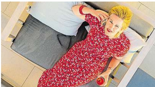
Čtyřicítka u mužů stejně jako u žen v přechodu.

Pětapadesátníci le-noši? Chyba lávky. Život beze změny si teď přejí nejvíce lidé po čtyřicítce.