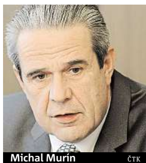
Michal Murín ČTK