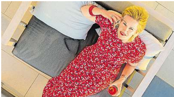
Čtyřicítka u mužů stejně jako u žen v přechodu.

Pětapadesátníci le- noši? Chyba lávky. Život beze změny si teď přejí nejvíc lidé po čtyřicítce.