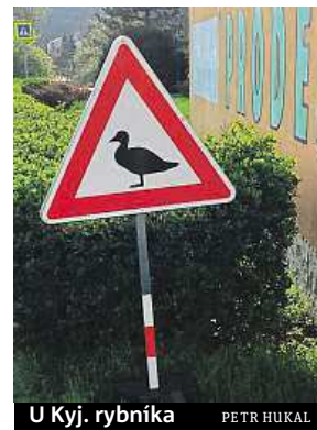
U Kyj. rybníka PETR HUKAL