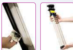
Filtry není třeba nikdy vyměňovat! Stačí je jen občas jednoduše vyjmout a otřít. Účinek filtrace ihned vidíte!

Čtvrtinu Čechů trápí alergie! Naše babičky trávily venku na louce nebo v seníku celé dny a alergickou rýmu neznaly. Za několik posledních let vzrostl počet astmatiků o neuvěřitelných 170 % a alergická rýma trápí už 40% českých dětí. Čím to je? Na vině je především náš „moderní“ způsob života, díky němuž trávíme příliš mnoho času v umělém a nezdravém prostředí, na které není náš organismus stavěný.