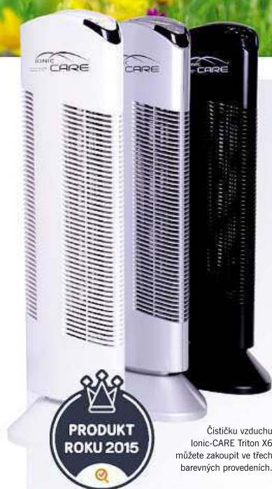
Čističku vzduchu Ionic-CARE Triton X6 můžete zakoupit ve třech barevných provedeníích.

Zdravý vzduch z přírody do vašich domovů