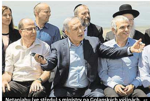
Netanjahu (ve středu) s ministry na Golanských výšinách.

Nepřátelské síly musí být ze Sýrie vytlačeny, řekl izraelský premiér.