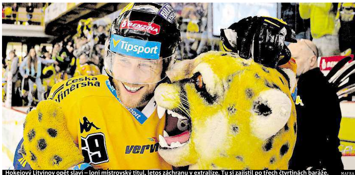
Hokejový Litvínov opět slaví – loni mistrovský titul, letos záchranu v extralize. Tu si zajistil po třech čtvrtinách baráže. MAFRA

Konflikty s násilím. V českých domácnostech jich přibývá. Metropole. Jen za první tři měsíce roku policie vykázala z bytu téměř 50 agresorů. Největší riziko ohrožení. Především ženy žijící s druhem a dětmi STRANA 3