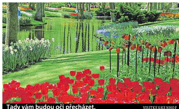
Tady vám budou oči přecházet.