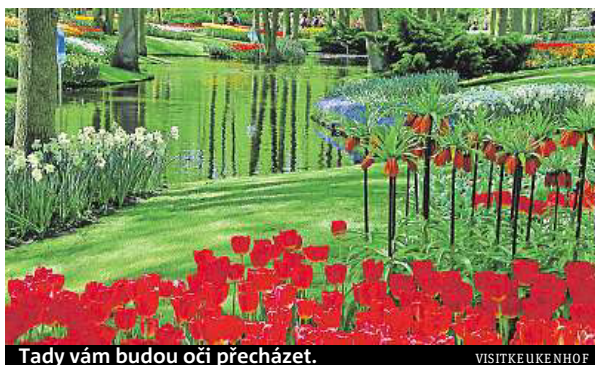
Tady vám budou oči přecházet.