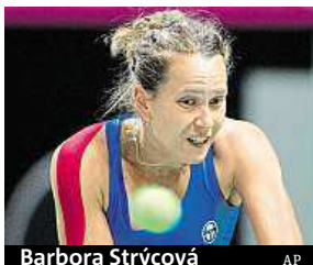
Barbora Strýcová

Obhájkyně titulu zdolaly v semifinále Švýcarsko po boji 3:2. Rozhodly o tom až Lucie Hradecká s Karolínou Plíškovou, které ve čtyřhře porazily Martinu Hingisovou s Viktorií Golubicovou dvakrát 6:2. Češky postoupily do finále soutěže družstev popáté za šest let a můžou zkompletovat vítězný hat-trick. Finále proti Francii se uskuteční 12. a 13. listopadu. Češky pocesutují na půdu soupeřek.