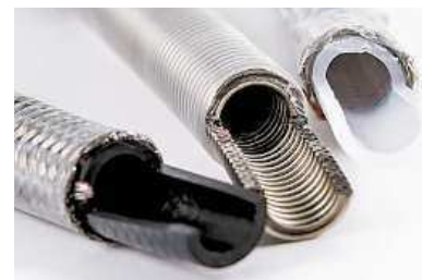
Rez vodovodními hadičkami, zleva: z pryže, z nerezové oceli (hadička Flexira), ze silikonu

Ať už v koupelně, v kuchyni, v záchodu, myčce či pračce, z hlavy teď můžete vypustit starosti s výměnou hadičky i obavy z vytopení. Vodovodní hadička Flexira xConnect Aqua od společnosti AZ – Pokorný je nyní dostupná ve všech prodejnách Datart.