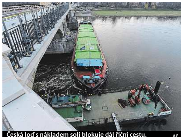
Česká loď s nákladem soli blokuje dál říční cestu.

Loď plující pod jménem Albis uvázla u Albertova mostu v pondělí pozdě večer. Drážďanský vodní a plavební úřad po nehodě uvedl, že loď pravděpodobně najela na mělčinu a silný proud ji strhl ke straně. Říční policie sdělila, že plavidlu při podplouvání mostu vypověděl motor. Kapitán se prý ještě pokusil loď vyrovnat, to se mu ale nepodařilo. Loď zůstala zaklíněna na mostních pilířích. Rejdaři se