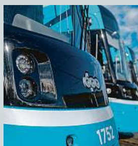
Tramvaje Škoda 39T jsou nově v provozu ostravského dopravního podniku.