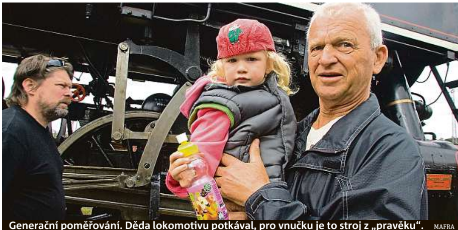
Generační poměrování. Děda lokomotivu potkával, pro vnučku je to stroj z „pravěku“. MAIRA

Jistě je to důležité. Jsou to zkušenosti a zkušenost je základem vzpomínky. Nikdy to není statické a neměnné. Nikdy to není fotografické zachycení děje. V průběhu času se vzpomínky mění. Protože událostem přidáváme význam i podle toho, co jsme už zažili, s poznáním se to