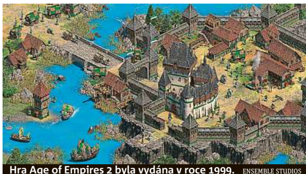
Hra Age of Empires 2 byla vydána v roce 1999. ENSEMBLE STUDIOS