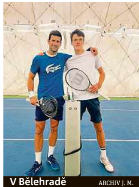
V Bělehradě

Letošní rok začal pro šestnáctiletého tenistu Jakuba Menšíka až neuvěřitelně. Nejdříve si splnil jeden ze svých velkých snů – hrát grandslam Australian Open. V něm se dostal až do finále a ve slavné aréně Roda Laveria si díky mimořádně bojovnému výkonu získal srdce mnoha fanoušků bílého sportu doma i po celém světě. Další splněné přání na sebe nenechalo dlouho čekat. Několik dní po návratu z Austrálie přišla světové juniorské trojce na mobil video zpráva a na druhé straně se ozvalo: „Hello, my friend.“ Gratulantem byl Jakubův velký tenisový vzor, světová jednička Novak Djokovič.