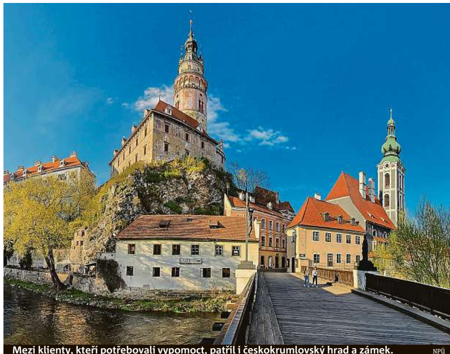
Mezi klienty, kteří potřebovali vypomocet, patřil i českokrumlovský hrad a zámek.