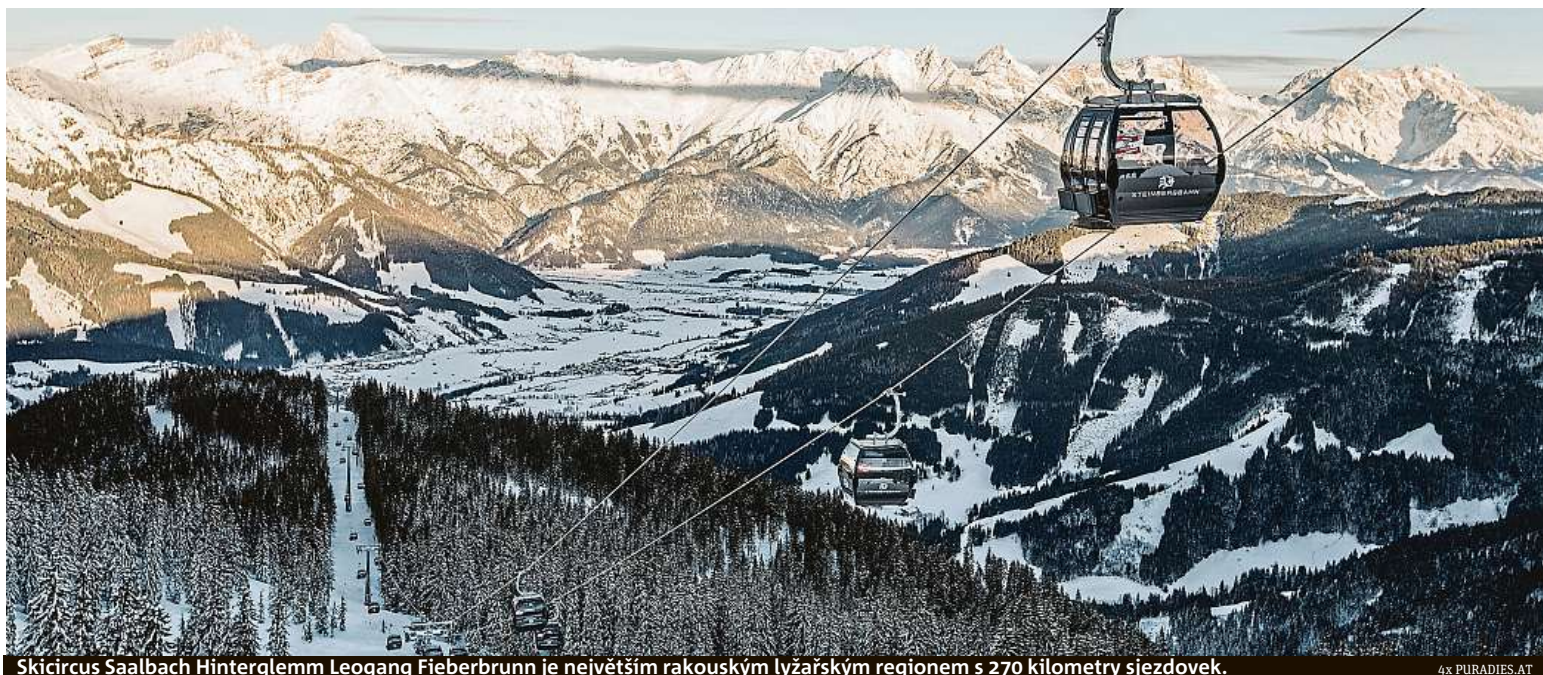
Skicircus Saalbach Hinterglemm Leogang Fieberbrunn je největším rakouským lyžařským regionem s 270 kilometry sjezdovek.