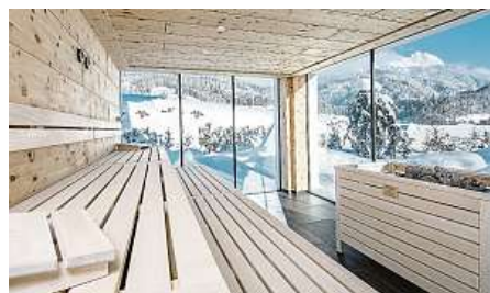
Vhodná základna pro různé zimní zážitky – přehled cen za noc najdete na webu.

nevíte, kde začínají a končí hory, a to je nezapomenutelný zážitek zejména při pobytu v panoramatických voňavých saunách zdejšího Heaven Spa, v němž nechybí ani