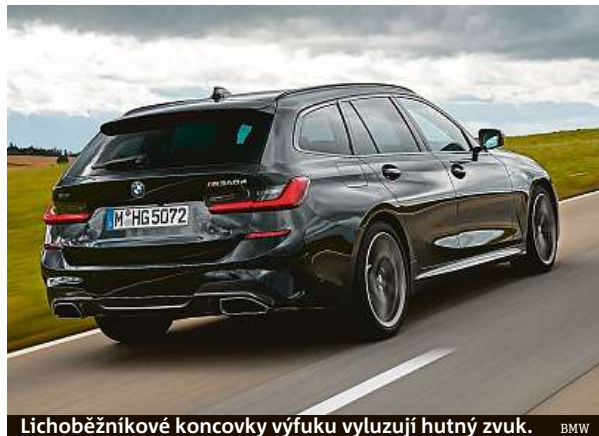
Lichoběžníkové koncovky výfuku vyluzují hutný zvuk.