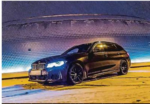
Model preferuje pohon zadních kol. Bavi i na sněhu.