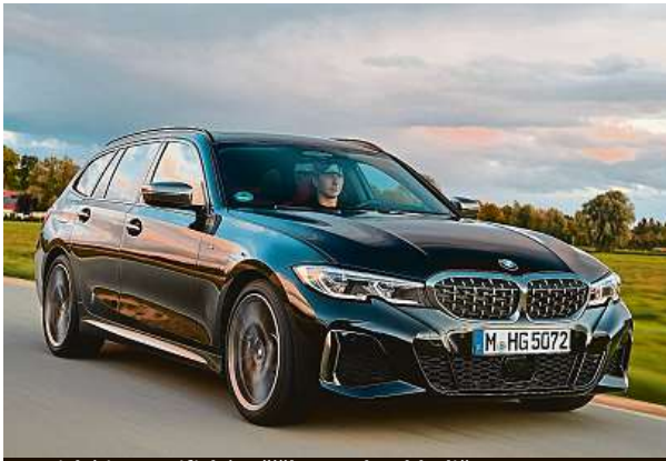
Typická je specifická mřížka masky chladiče.