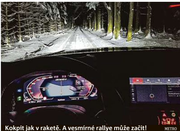
Kokpit jak v raketě. A vesmírné rallye může začít!