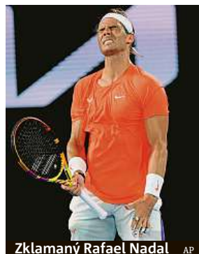
Zklamán Rafael Nadal

Smutnou dohru má Australian Open pro loňskou vítěz-