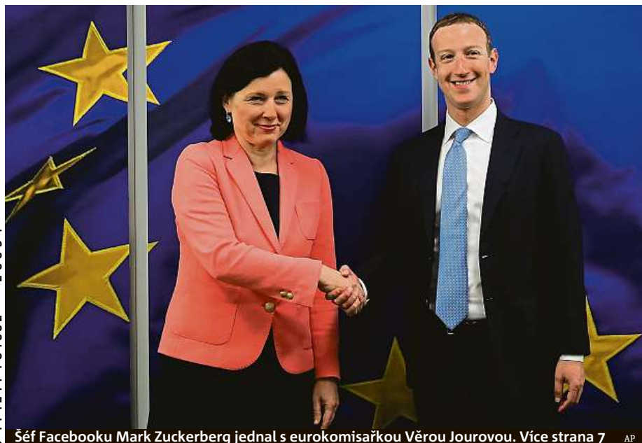
Séf Facebooku Mark Zuckerberg jednal s eurokomisařkou Věrou Jourovou. Více strana 7