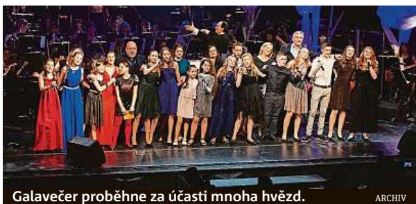
Galavečer proběhne za účasti mnoha hvězd.

Všech 13 finalistů si v období říjen až únor prošlo hodinami zpěvu s hlasovou poradkyní Kühnova dětského sbo-