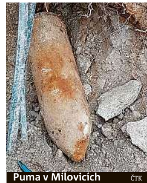
Puma v Milovicích ČTK

Letecká puma byla převezena na stálovou trhací jámu do Ralska a tam byla odborně zlikvidována. Puma se našla v bezprostřední blízkosti autobusové zastávky Milovice. Zábavní park je přes zimu uzavřený. ČTK