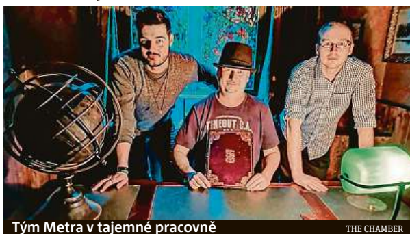
Tým Metra v tajemné pracovně

První hrou je Wonderland, který je, jak už název napovídá, plný divů, zvuků, barev