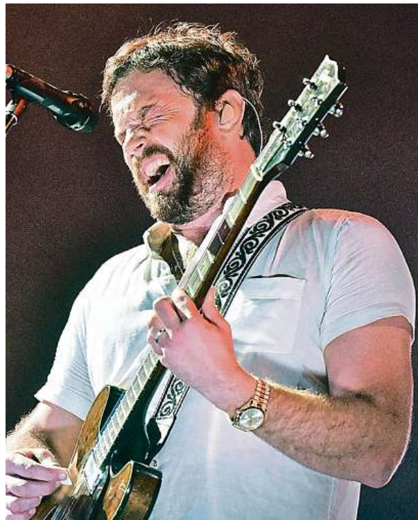
Caleb Followill, frontman Kings of Leon

Newyorské indie legendy The Strokes pak představí návštěvníkům festivalu letošní nové album. I díky této kapelle jsme zažili znovuoživení garážového zvuku šedesátých let na počátku nového milénia. Tahle kapela si s hlavním pódium a obrovským davem fanoušků pod ním bude určitě dobře rozumět.