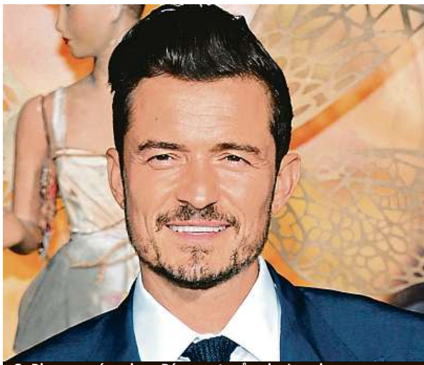
O. Bloom, známe ho z Pána prstenů coby Legolase.

Takzvané filmové pobídky jsou v ČR od roku 2010, vrací se při nich filmařům 20 procent nákladů. Už několik let se mluví o tom, že zejména americké filmové štáby opouštějí dříve hodně využívané české služby a jezdí do států s vyšší vratkou. Zájem o práci českých filmařů ale stále je, oživil ho boom televizní seriálové tvorby. Státní fond kinematografie byl