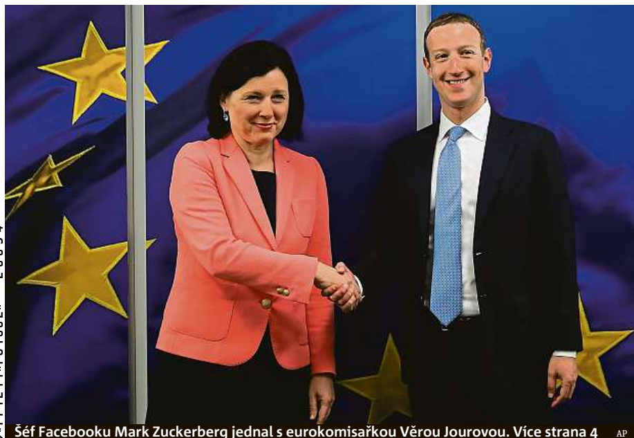
Séf Facebooku Mark Zuckerberg jednal s eurokomisařkou Věrou Jourovou. Více strana 4