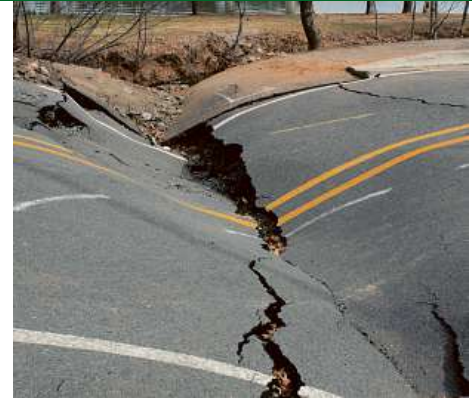
Road after earthquake