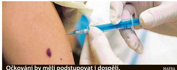
Očkování by měli podstupovat i dospělí.