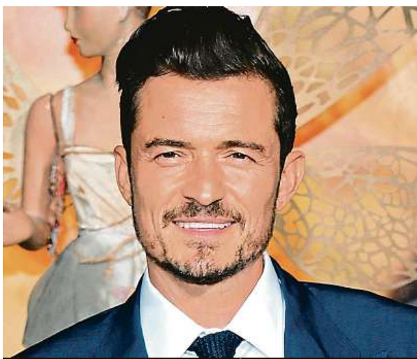
O. Bloom, známé ho z Pána prstenů coby Legolase.

Takzvané filmové pobídky jsou v ČR od roku 2010, vrací se při nich filmařům 20 procent nákladů. Už několik let se mluví o tom, že zejména americké filmové štáby opouštějí dříve hodně využívané české služby a jezdí do států s vyšší vratkou. Zájem o práci českých filmařů ale stále je, oživil ho boom televizní seriálové tvorby. Státní fond kinematografie byl