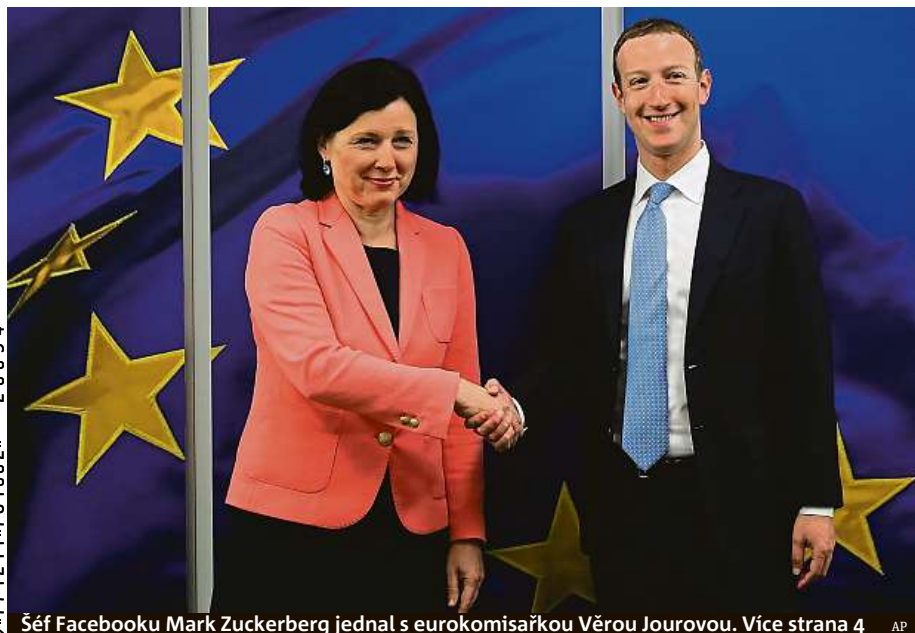
Séf Facebooku Mark Zuckerberg jednal s eurokomisařkou Věrou Jourovou. Více strana 4