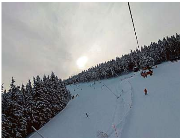
Modrá sjezdovka na Hromovku je oblíbená.