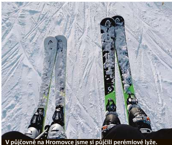
V půjčovně na Hromovce jsme si půjčili peremiové lyže.