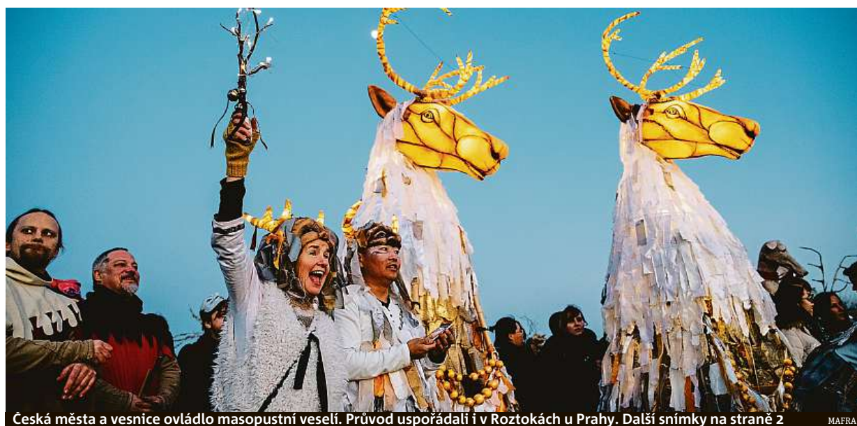
Ceská města a vesnice ovládlo masopustní veselí. Průvod uspořádali i v Roztokách u Prahy. Další snímky na straně 2

Nejen nezvladatelné děti. V dospělosti obvykle mizí příznaky ADHD, ne ale samotná porucha. Závislosti. Pacienti více tíhnou k drogám nebo hráčství. Trpí rodina. Lidé si nejsou schopni udržet delší vztah STRANA 7