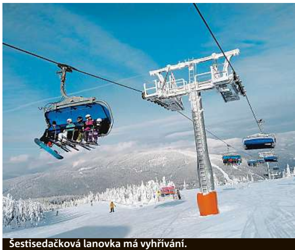
Šestisedačková lanovka má vyhřívání.