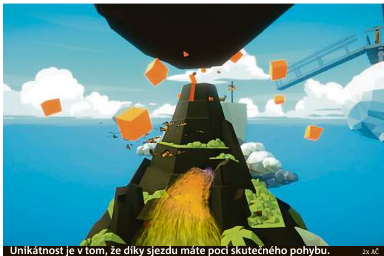
Unikátnost je v tom, že díky sjezdu máte poci skutečného pohybu.