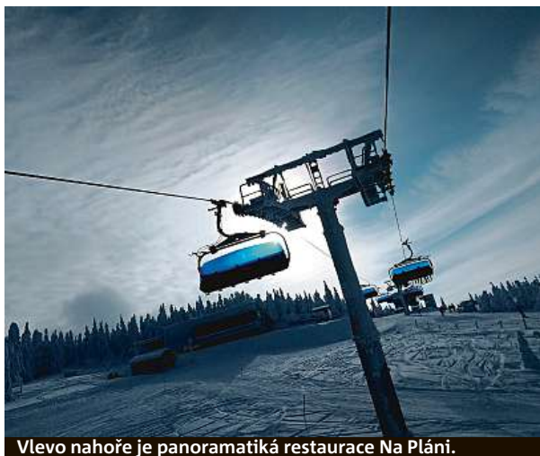
Vlevo nahoře je panoramatiká restaurace Na Pláni.