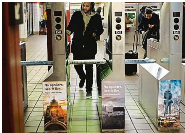
Česko vsází na reklamu v americkém metru.