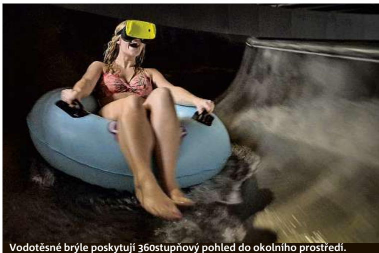
Vodotěsné brýle poskytují 360stupňový pohled do okolního prostředí.