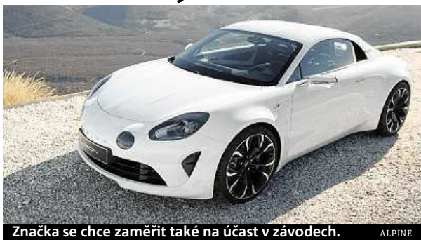
Značka se chce zaměřit také na účast v závodech. ALPINE

Značka Alpine spjatá s francouzskou automobilkou Renault je zpět. Bylo odhaleno koncepční kupé Vision, které se v minimálně pozměněné podobě začne prodávat už příští rok. Vzhled auta navazuje na legendární model A110, nejslavnější vůz Alpine. Bude ho pohánět turbodmychadlem přepínaný čtyřválec z dílny divize Renaultsport o obsahu 1,8 litru. Díky němu zrychlí z 0 na 100