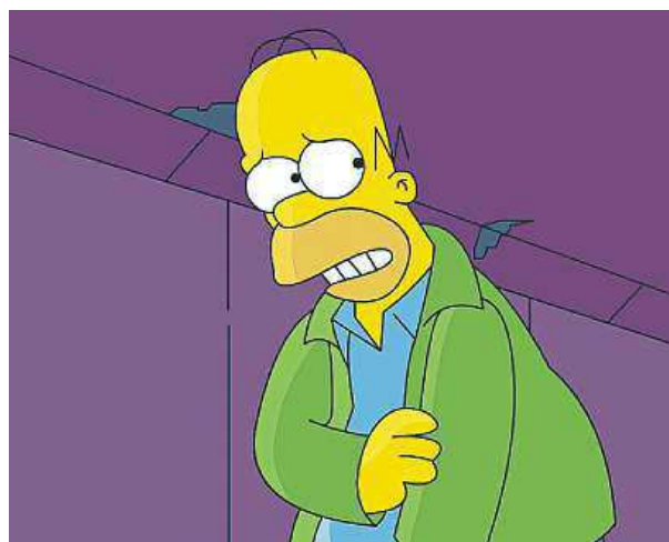
Animovaný Homer Simpson se objeví v nové úloze.

„Pokud vím, je to poprvé, co bude něco takového před-