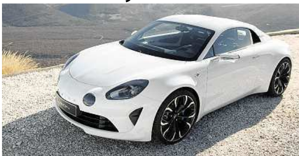
Značka se chce zaměřit také na účast v závodech. ALPINE

Značka Alpine spjatá s francouzskou automobilkou Renault je zpět. Bylo odhaleno koncepční kupé Vision, které se v minimálně pozměněné podobě začne prodávat už příští rok. Vzhled auta navazuje na legendární model A110, nejslavnější vůz Alpine. Bude ho pohánět turbodmychadlem přepínaný čtyřválec z dílny divize Renaultsport o obsahu 1,8 litru. Díky němu zrychlí z 0 na 100