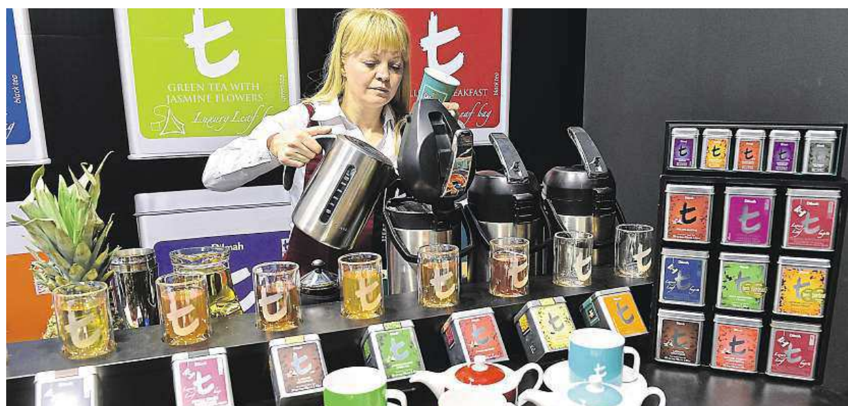
Na brněnském výstavišti probíhá veletrh potravin a potravinářských technologií Salima a 1. ročník Festivalu minipivovarů.

Velké zpoždění. Řidiči měli už od Nového roku jezdit rychleji na mnoha místech Česka. Papírování. Přípravované změny však brzdí komunikace mezi úřady, pak se ještě musí instalovat dopravní značky STRANA 2