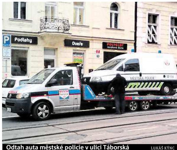
Odtah auta městské policie v ulici Táborská

„Čekal jsem zrovna na kamaráda, když jsem najednou uslyšel hádku strážníků a řidiče odtahové služby,“ popisuje svou netradiční zkušenost