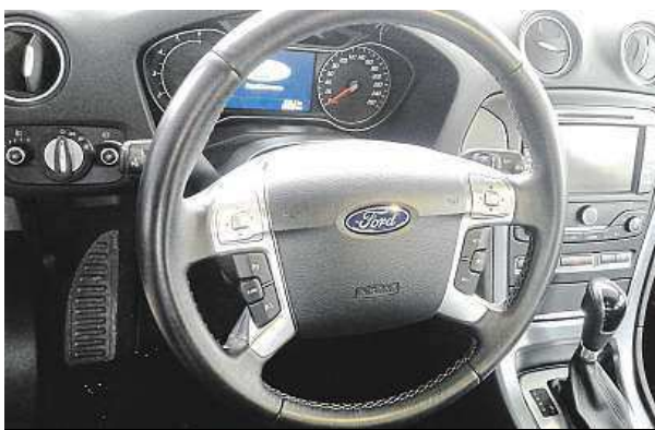
Tohle mondeo má právě za sebou všechny prověrky, bylo i na kontrole geometrie. 3x AUTOTÝM