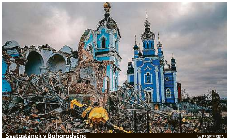
Svatostánek v Bohorodyče