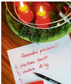
Jaká jsou ta vaše?

Důvodem nenaplněných přání proto není pouze slabá vůle nebo to, že „na to nemáte“. Často je na vině chybné plánování. „Je potřeba, aby byly cíle co nejvíce konkrétní – co, kdy, kde, jak. Aby byly dosažitelné, což poznáme tak, že si je umíme představit,“ vysvětluje Radka Loja,