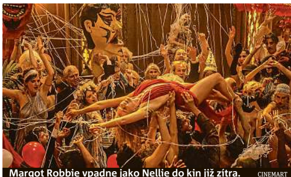
Margot Robbie vpadne jako Nellie do kin již zítra.

Děj Babylonu vypráví o neznámé dívce Nellie LaRoy (Margot Robbie), která si za poslední peníze koupila hezké šaty a vetřela se na bujarý večírek filmařů. Svědkem její následné strmé kariéry je „holka pro všechno“ Manny Torres (Diego Calva), mexický přistěhovalec, který plní filmovým magnátům i ty nejdřívější sny. Třeba vám na večírek přivede živého slona. V rámci svých povinností Manny pečuje i o Jacka Conrada (Brad Pitt), nejslavnějšího herce své doby, který moc dobře ví, jak je těžké se na vrcholu udržet, a který dělá možné i nemožné pro to, aby na něm zůstal. Na obzoru se však rýsuje již naznačovaná