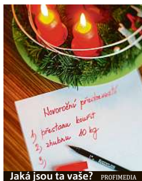
Jaká jsou ta vaše?

Důvodem nenaplněných přání proto není pouze slabá vůle nebo to, že „na to nemáte“. Často je na vině chybné plánování. „Je potřeba, aby byly cíle co nejvíce konkrétní – co, kdy, kde, jak. Aby byly dosažitelné, což poznáme tak, že si je umíme představit,“ vysvětluje Radka Loja,