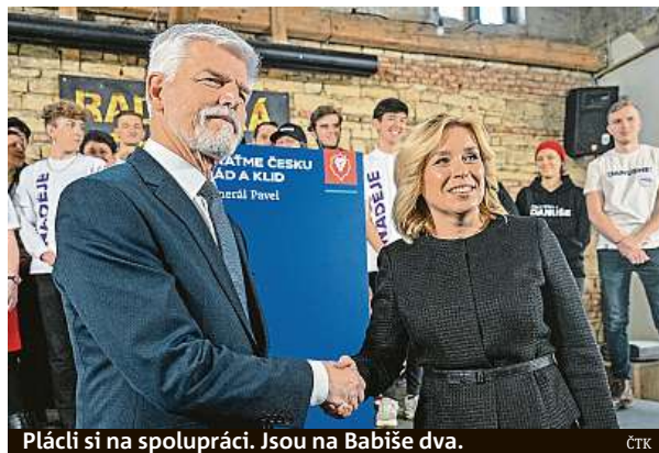
Pláclí si na spolupráci. Jsou na Babiše dva.