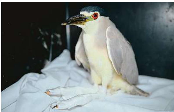
Kvakošovi se nohy hojily měsíc a půl. Dnes už je v Africe. LHMP

Nejčastěji přijímaným volně žijícím živočichem byl