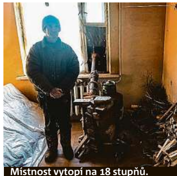
Místnost vytopí na 18 stupňů.