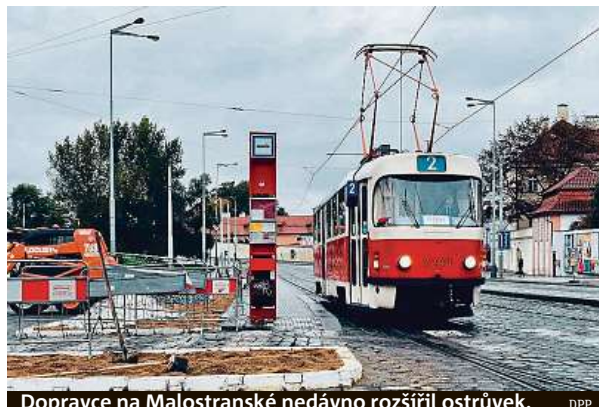
Dopravce na Malostranské nedávno rozšířil ostrůvek.

Dopravce bude v rámci připravované opravy tratě vyměňovat pouze ty nejpotřebovanější a nejstarší kolejnice