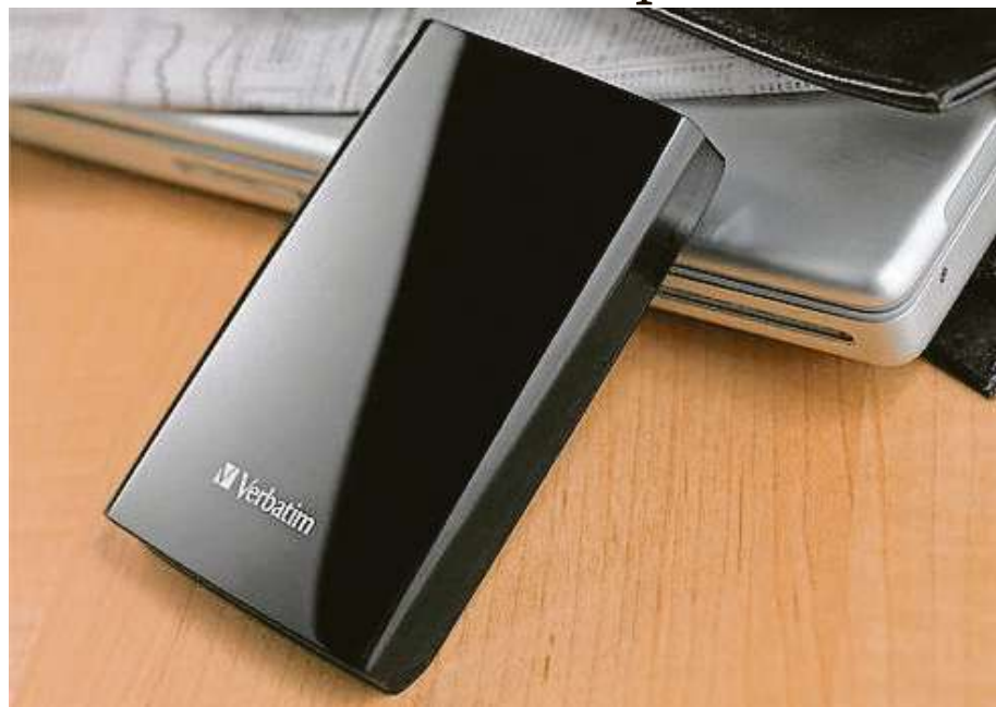
Verbatim Store'n'Go 1TB pojme více informací než kniha.

Verbatim Store'n'Go také není žádný hlemýžď. Disk o standardním formátu 2,5" běží na 5400 otáčkách za minutu a má vyrovnávací paměť 8 MB. Díky univerzálnímu rozhraní USB 3.0 zvládne přenášet data rychlostí až 625 MB/s. Také proto se rychle stal jedním z nejprodávanějších externích disků na trhu. Na těchto perfektních prodejních výsledcích má velký podíl také příznivá cena. V internetovém obchodě Mironet můžete externí disk Verbatim Store'n'Go 1TB pořídit v povánočním výprodeji už za 1229 Kč.