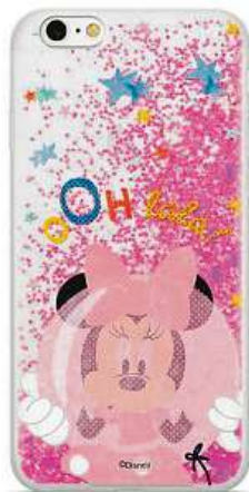
Kryt s motivem Minnie