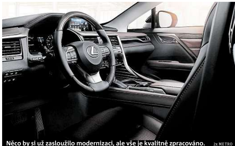
Něco by si už zasloužilo modernizaci, ale vše je kvalitně zpracováno.