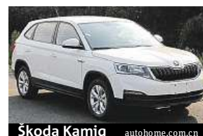
Škoda Kamiq

Kamiq má mít premiéru na jarním autosalonu v Pekingu, prodeje odstartují v červnu. Škoda má nyní v nabídce velké, až sedmimístné SUV jménem Kodiaq a menší Karoq. Chystá se ještě malý crossover, který nahradí Fabii Combi. FDV, IDNES.cz