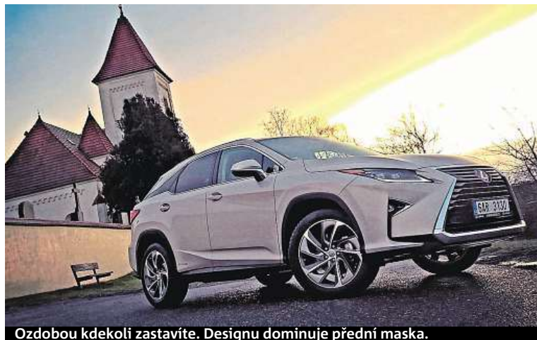
Ozdobou kdekoli zastavíte. Designu dominuje přední maska.