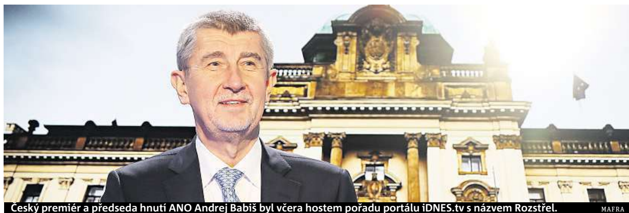
Ceský premiér a předseda hnutí ANO Andrej Babiš byl včera hostem pořadu portálu iDNES.tv s názvem Rozstřel.

Konec krátké vlády. Po šestatřiceti dnech od jmenování podal kabinet vedený šéfem hnutí ANO demisi. Podpora. Pro Piráty, Starosty a TOP 09 je Babiš nemyslitelný STRANA 2