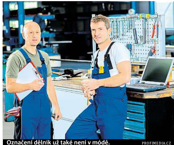
Označení dělník už také není v módě.

Dříve málo vídaným jsem je také v současnosti obvyklé různé pojmenování pro shodnou profesi. Sekretářky už dnes nejsou v kurzu, zato se to v inzerátech hemží profesemi, jako jsou office support, office coordinator, office manager, executive assistant či personal assistant. Ve všech případech se jedná o práci pro asistenty či asistentky, dříve sekretářky. MET