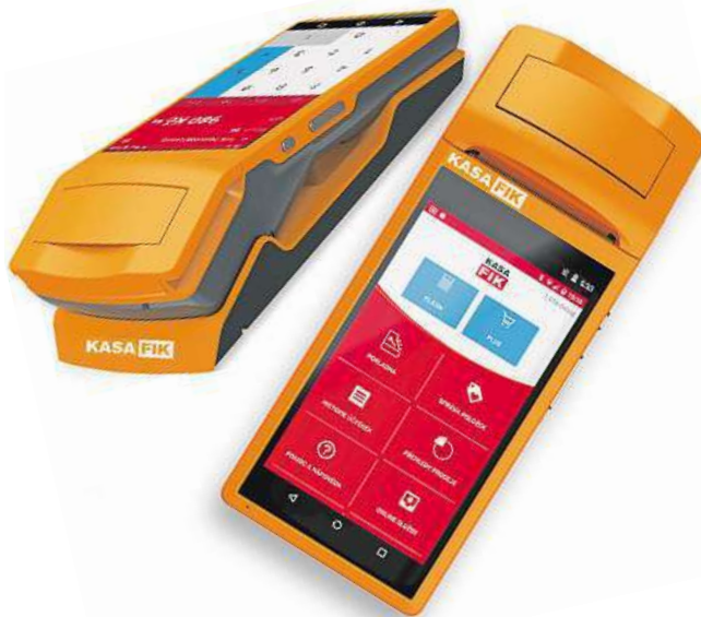
KASA FIK si popularitu získaly pro svou jednoduchost.

To znamená, že pokud by vám náhodou vybrané zařízení nevyhovovalo, stačí je vyměnit za jiné a zaplatit až v avizované lhůtě dvou týdnů. Přidáme rovnou i třetí tip, a to na jaké produkty se zaměřit. Těmi nejprodávanějšími jsou výrobky KASA FIK, jež si svou popularitu získaly hlavně pro svou jednoduchost, snadné ovládání, kvalitu zpracování a v neposlední řadě také třeba zásluhou pokladniční aplikace bez jakýchkoli paušálních poplatků. Jejich EET řešení budoují i příznivou cenou a jsou dostupná již od 3999 korun.