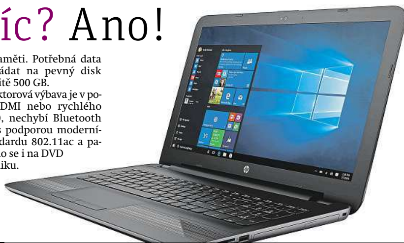
HP 255 G5, držák za dobrou cenu

Konektorová výbava je v podobě HDMI nebo rychlého USB 3.0, nechybí Bluetooth a wi-fi s podporou moderního standardu 802.11ac a pamatovalo se i na DVD mechaniku.