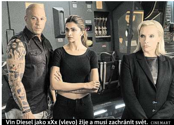
Vin Diesel jako xXx (vlevo) žije a musí zachránit svět.

Jelikož oficiální vládní složky si s tím nevědí rady, je na