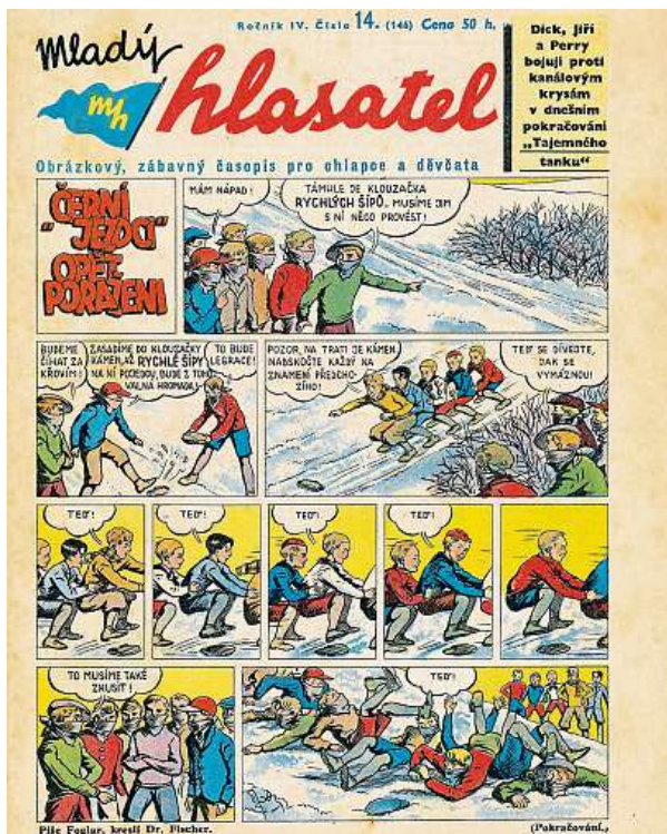
Černí jezdcí v Mladém hlasateli