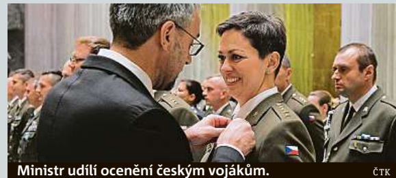
Ministr udílí ocenění českým vojákům.