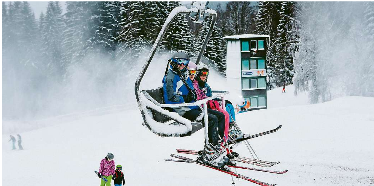
Sobotní lyžovačka na Špičáku. Sněhu tu zatím není moc, sněžná děla jedou naplno nonstop. Ceny skipasů jsou do pátku levnější.