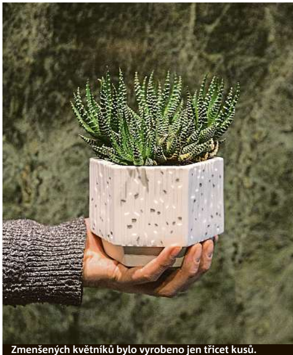
Zmenšených květináčů bylo vyrobeno jen třicet kusů.

Zmenšená verze květináčů od A489 není z betonu, ale z porcelánu. „Chtěli jsme tímto kontrastem upozornit na stav, v jakém se většina původních květináčů nachází. Jsou ošuntělé, špatně osázené a často se neví, co s nimi. My je ukazujeme v jiném světle, jako designovou záležitost z ušlechtilého materiálu,“