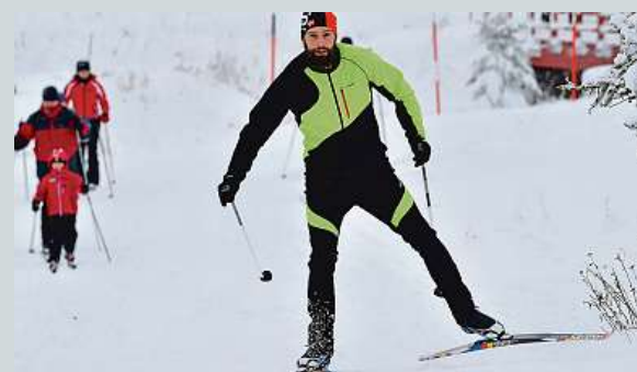
Boží Dar už je zase plný lyžařů.