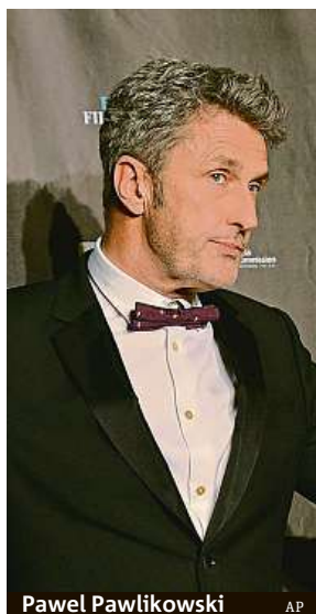
Pawel Pawlikowski

Cenu Evropské filmové akademie (EFA) pro nejlepší film roku získal polsko-britsko-francouzský snímek Studená válka. Film na 31. ročníku udílení ocenění EFA ve španělské Seville uspěl i v dalších kategoriích. Autor filmu Pawel Pawlikowski, 61letý režisér a scenárista polského původu, jenž působí především v Británii, si převzal ceny pro nejlepšího režiséra a také scenáristu. Představitelka hlavní role Joanna Kuligová byla vyhlášena nejlepší herečkou. Evropské filmové ceny jsou považovány za evropskou obdobu amerických Oscarů. Drama Studená válka se odehrává v Polsku a Francii v době studené války a na jejím pozadí vypráví příběh