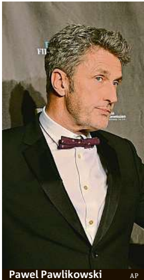
Pawel Pawlikowski

Cenu Evropské filmové akademie (EFA) pro nejlepší film roku získal polsko-britsko-francouzský snímek Studená válka. Film na 31. ročníku udílení ocenění EFA ve španělské Seville uspěl i v dalších kategoriích. Autor filmu Pawel Pawlikowski, 61letý režisér a scenárista polského původu, jenž působí především v Británii, si převzal ceny pro nejlepšího režiséra a také scenáristu. Představitelka hlavní role Joanna Kuligová byla vyhlášena nejlepší herečkou. Evropské filmové ceny jsou považovány za evropskou obdobu amerických Oscarů. Drama Studená válka se odehrává v Polsku a Francii v době studené války a na jejím pozadí vypráví příběh