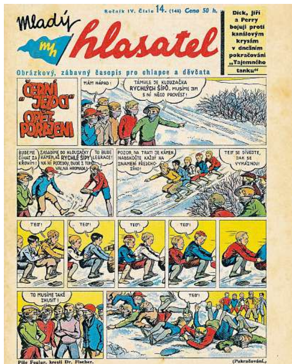
Cerní jezci v Mladém hlasateli