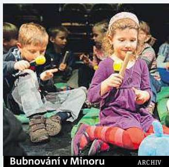
Bubnování v Minoru