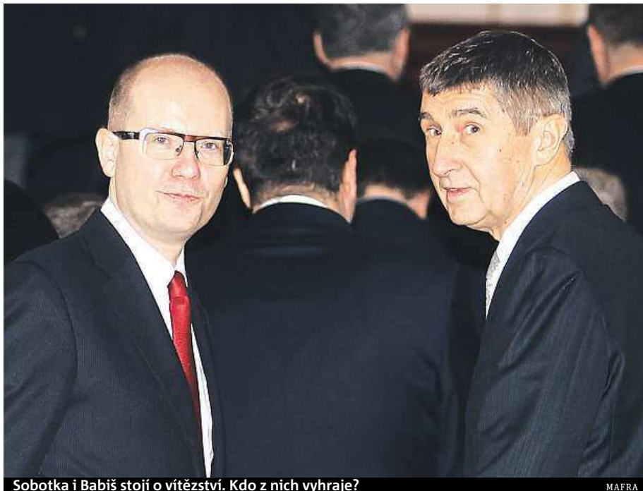
Sobotka i Babiš stojí o vítězství. Kdo z nich vyhraje?

Hnutí ANO před dvěma lety neuspělo, letos je ve zcela jiné pozici. Šéf hnutí ANO Andrej Babiš před volbou uvedl, že chce získat deset senátních křesel, ve druhém kole