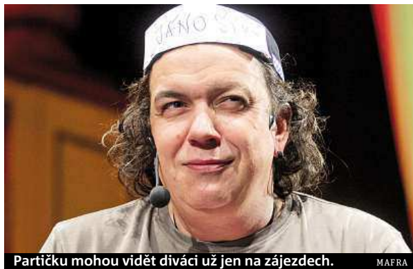
Partičku mohou vidět diváci už jen na zájezdech.

Ano, teď v neděli uvidí diváci člověka, který ujel na koloběžce Tour de France. Což si myslím, že je úplný psychopat. Tahle banda lidí musí zá-