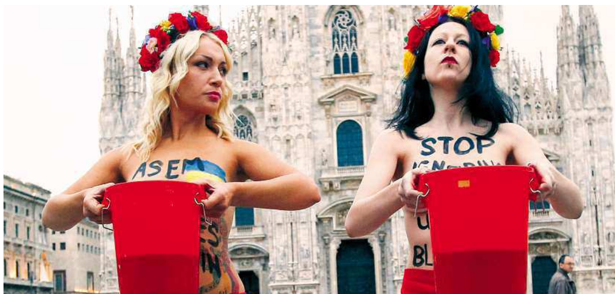
Poléváním falešnou krví v italském Miláně včera polonahé ukrajinské aktivistky poukázaly na situaci ve své zemi.

Přetahování klientů. Nová akce České spořitelny s úrokem 2,29 procenta začíná v pondělí. Rychlá reakce. Banky musí jít dolů, fixace se podepisuje i na 10 let. Skok. Na jaře byla stejná akce s úrokem 2,69 STRANA 4