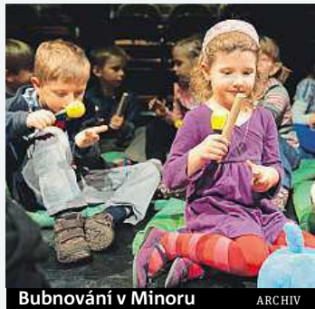
Bubnování v Minoru