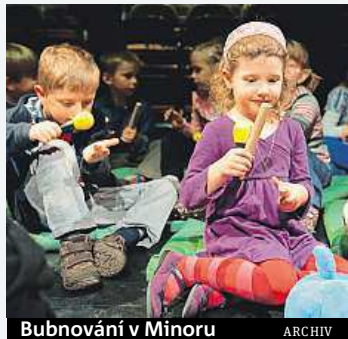
Bubnování v Minoru.