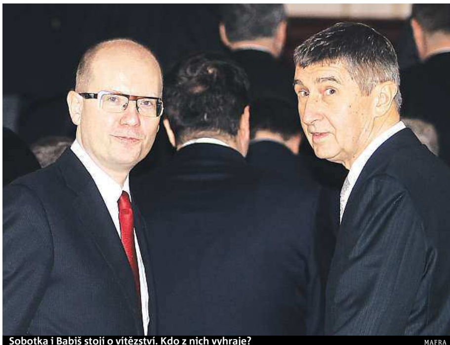
Sobotka i Babiš stojí o vítězství. Kdo z nich vyhraje?

Hnutí ANO před dvěma lety neuspělo, letos je ve zcela jiné pozici. Šéf hnutí ANO Andrej Babiš před volbou uvedl, že chce získat deset senátních křesle, ve druhém kole