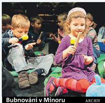
Bubnování v Minoru