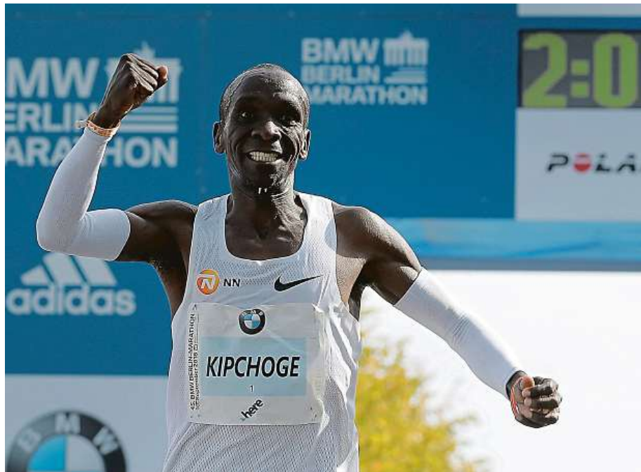
Keňský vytrvalec Eliud Kipchoge v Berlíně triumfoval potřeť a obhájil loňské vítězství.

Závod žen vyhrála Gladys Cheronová z Keni v traťovém rekordu 2:18:11.