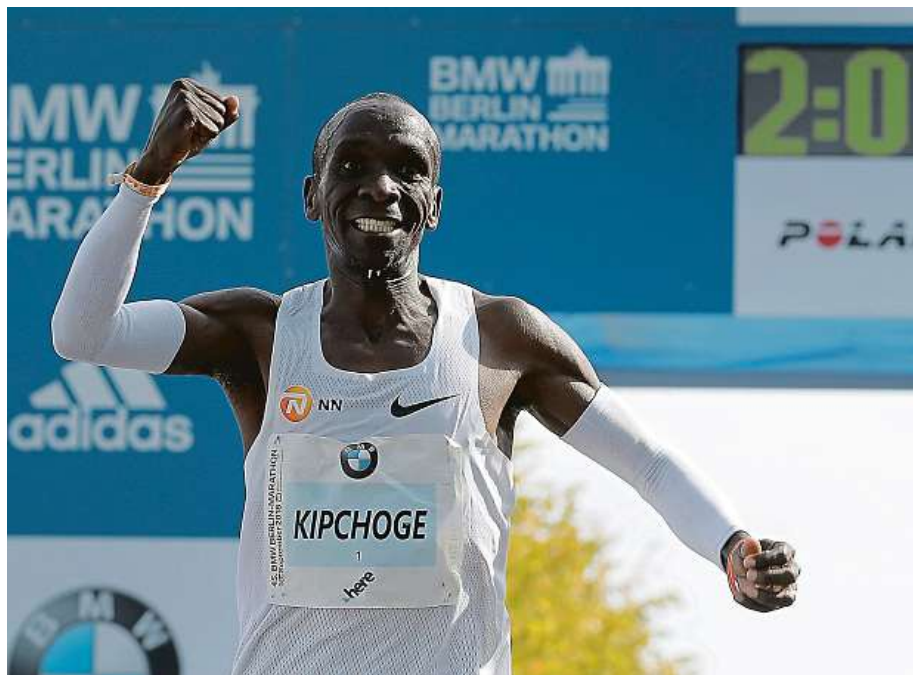
Keňský vytrvalec Eliud Kipchoge v Berlíně triumfoval potřeť a obhájil loňské vítězství.

Závod žen vyhrála Gladys Cheronová z Keni v tratovém rekordu 2:18:11.