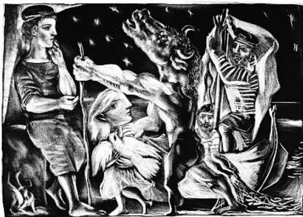
Dívka s holubicí vede noci slepého Minotaura (1934)