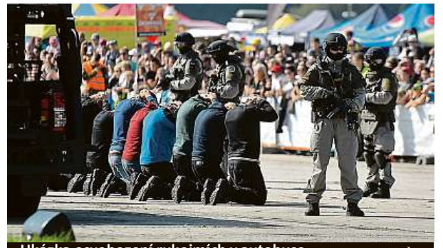
Ukázka osvobození rukojmích v autobuse