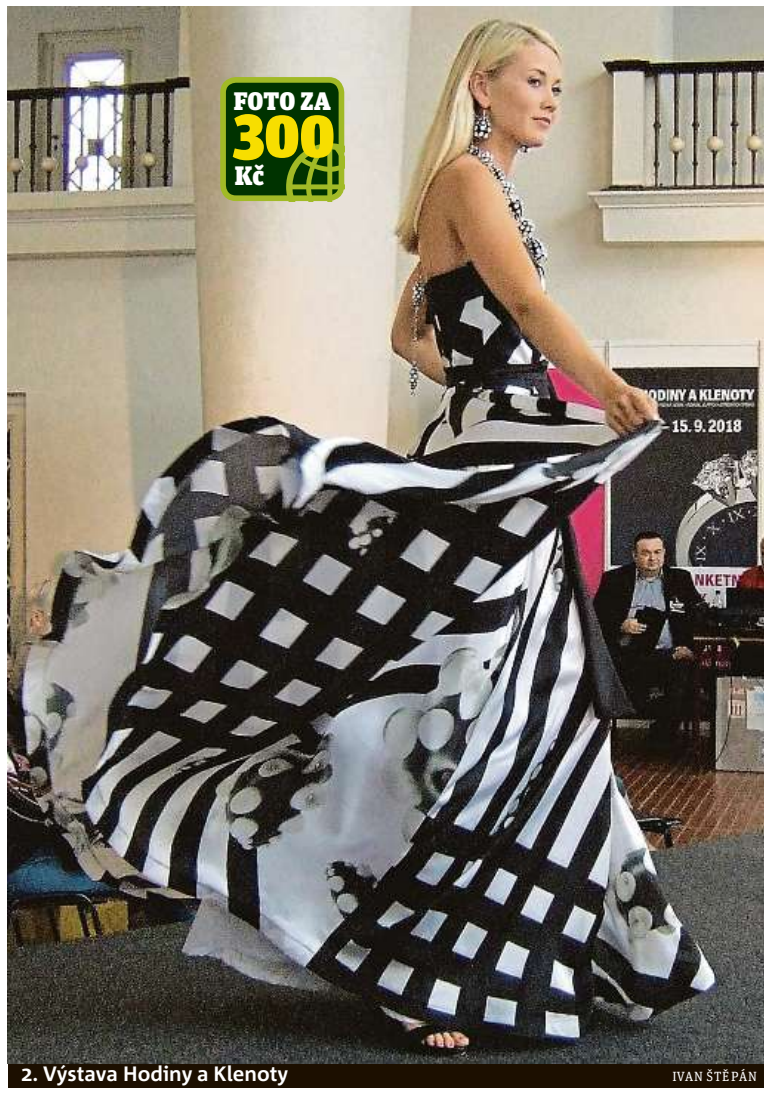
2. Výstava Hodiny a Klenoty