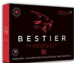
Bestier (pro energii)

Nyní při koupi všech kloubních i jiných přípravků hodnotný DÁREK dle vlastního výběru, např.