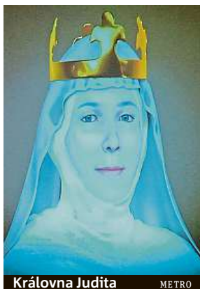
Královna Judita