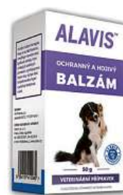
Alavis chranný a hojivý balzám pro psy