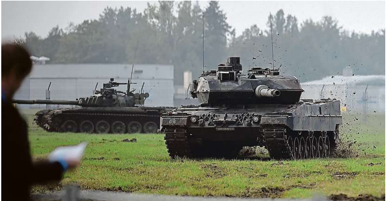
Umění předvedla posádka německého tanku Leopard 2 (vpravo) i českého tanku T-72M4CZ (v pozadí vlevo).

Velký zájem byl také o zhlédnutí amerického víceúčelového vrtulníku UH-1Y Venom zvaného Yankee, který byl poprvé k vidění nejen v Česku, ale i v Evropě. Vedle letadel se tu představily i naše a americké tanky. ČTK