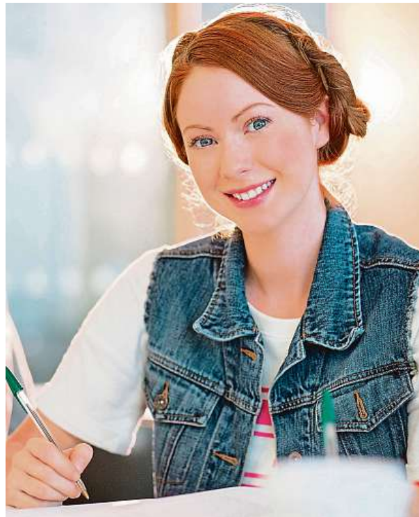
Počty přijatých studentů nejsou definitivní.

Ostatní vysoké školy, které odpověděly na dotaz ČTK, evidují nyní v porovnání s minulým rokem pokles zájmu. Například Jihočeská univerzita v Českých Budějovicích má meziroční úbytek uchazečů o deset procent a Univerzita Tomáše Bati ve Zlíně (UTB) asi o dvě až tři procenta. Pokles zájmu na UTB se týká hlavně společenskovedních oborů, zatímco o studium technických oborů vzrostl. Méně studentů se letos přihlásilo také na Vysokou školu ekonomickou v Praze. ČTK