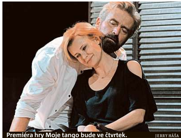
Premiéra hry Moje tango bude ve čtvrtek.