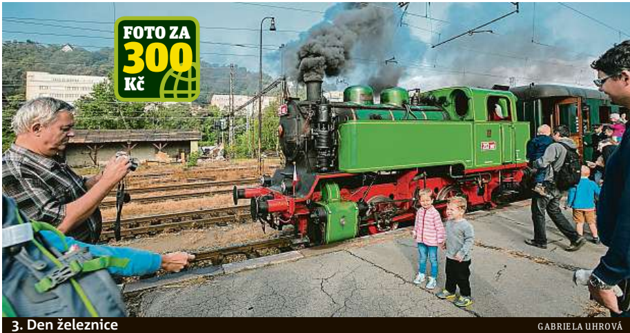
3. Den železnice