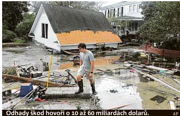
Odhady škod hovoří o 10 až 60 miliardách dolarů.

O tom, že Florence zeslábla na tropickou depresi, infor-