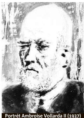
Portrét Ambroise Vollarda II (1937)

Picasso se v cyklu proměňuje v řeckého sochaře pracujícího na idyllickém ostrově. Otázky tvorby intenzivně narušuje jeho další alter ego, smyslný a destruktivní Minotaurus. Žádná vášeň ale nezůstává dlouho bez následků, bez viny a trestu. Ve výstavě je možno spatřit všech 100 listů, které Picasso vyryl a vyleptal pro svého přítele a galeristu Ambroise Vollarda. METRO