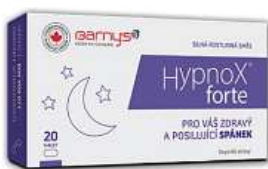
HypnoX Forte (pro lepší usínání)