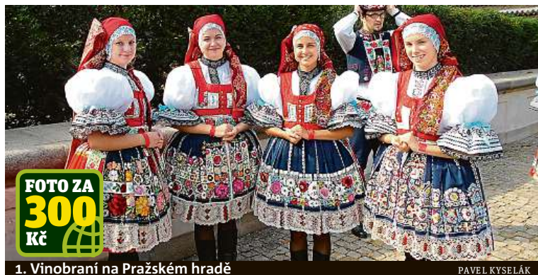
1. Vinobraní na Pražském hradě