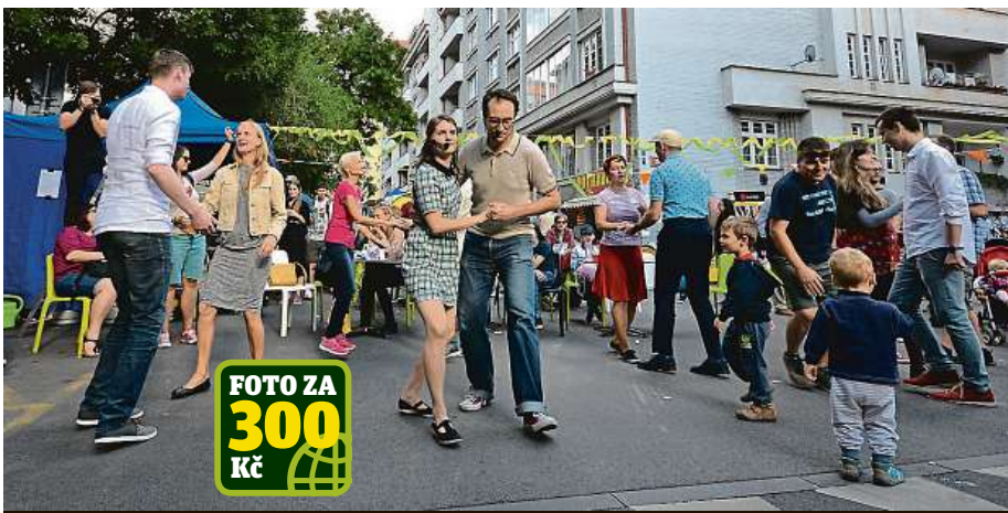
5. Zažít město jinak 2018