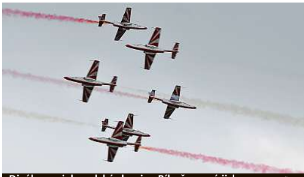
Diváky zaujala polská skupina Bílo-červené jiskry.