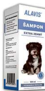
Alavis Extra jemný šampon pro psy