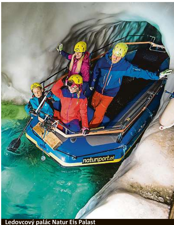
Ledovcový palác Natur Eis Palast

První lyžaři se na svah vydají na konci září. Monumentální je sjezd BIG3 rallye, trasa vede přes tři třítisícové vrcholy. „Sölden je hotspot Alp, pořád se tam něco děje. Party, koncerty, závody. No a samozřejmě James Bond. Výborná je restaurace Ice Q, která si za-