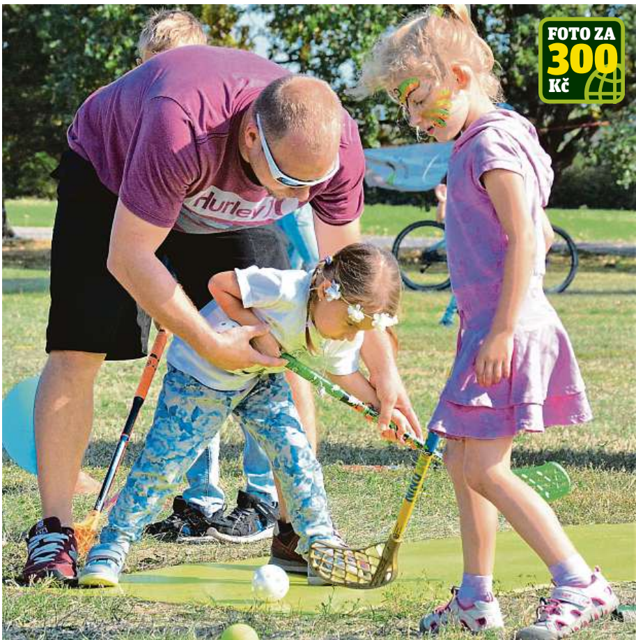
4. Festival volného času v parku Ladronka