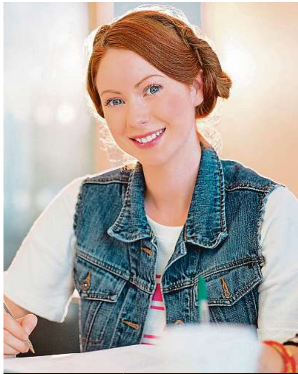
Počty přijatých studentů nejsou definitivní.

Naopak Univerzita Palackého v Olomouci zaznamenala již nyní mírný nárůst přihlášek ve srovnání s minulým rokem. Loni se o studium ucházelo 25 045 lidí, letos je to zatím 25 271. I zde přitom na některých oborech přijímací zkoušky pokračují. Největší nárůst zájmu byl letos u pedagogické fakulty, kam