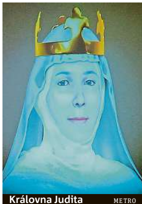
Královna Judita