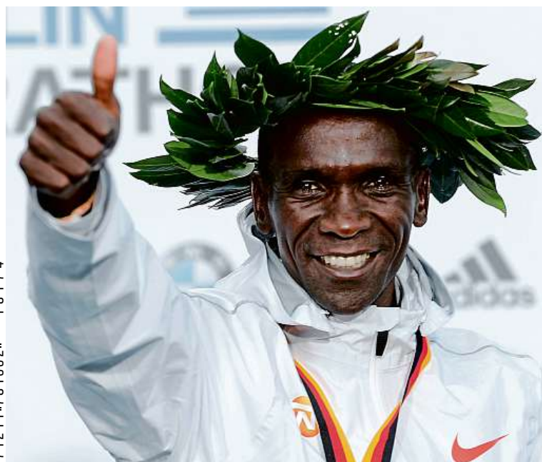
Eliud Kipchoge ovládl Berlínský maraton ve světovém rekordu. Více strana 16

Kombinovaná spotřeba a emise CO 2 : 3,6–6,6 l/100 km, 93–153 g/km. Zobrazené modely jsou pouze ilustrativní. Akce Opel 500 probíhá od 17. do 22. 9. 2018. Akční nabídka platí i pro ostatní modely. * Dvouletá výrobní zákonná záruka a dále tříletá smluvní záruka Opel. Více na www.opel.cz nebo u prodejce vozů Opel.