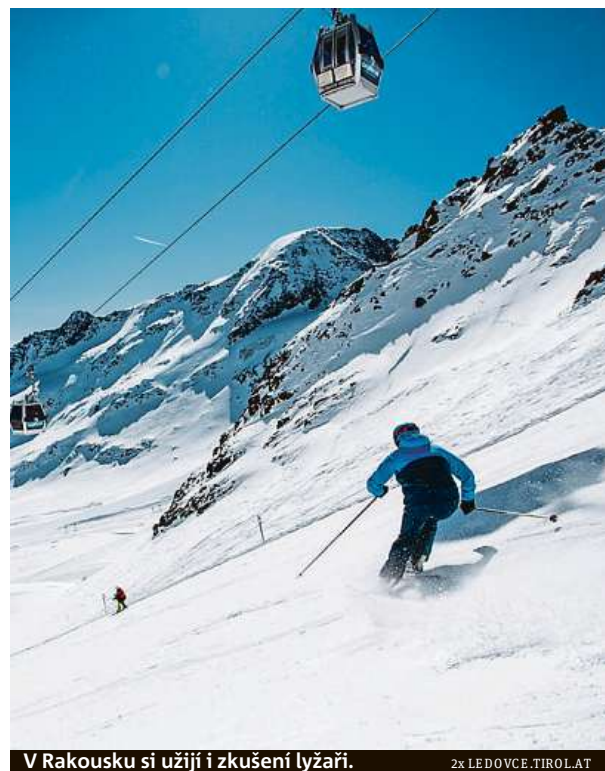
V Rakousku si užijí i zkušení lyžaři.

Je jediný skiareál v Rakousku s celoročním provozem, přesto dělají otevírací party