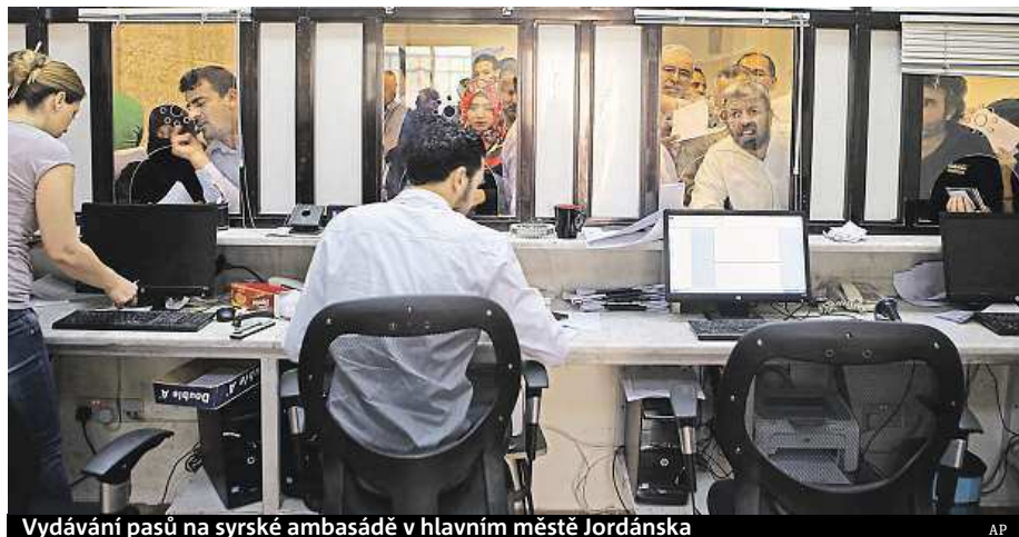
Vydávání pasů na syrské ambasádě v hlavním městě Jordánska

Lidé, kteří utíkají před boji v Sýrii, mohou opět získat pasy. Jsou však předražené a čeká se na ně aspoň měsíc.