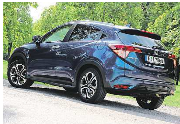
Nové HR-V sází na ladné křivky karoserie.