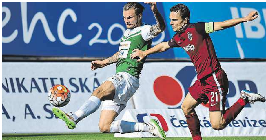
Také v lize Sparta v posledním odehraném kole hrála venku. V Jablonci remizovala 1:1. ČTK

Fotbalisté Liberce se po roční odmlce a celkové potřebě představí v základní skupině pohárů. Hned na úvod mohou splatit devět let starý dluh. V 1. kole Evropské ligy