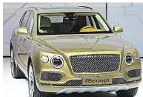
SUV od Bentleye

Má jít o nejvýkonnější terénní vůz s maximální rychlostí 301 km/h.