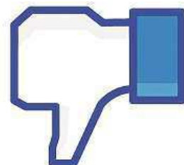
Nelíbí se mi.

K obratu ve filozofii ho podle jeho slov přinutily novější události s uprchlíky. Po-