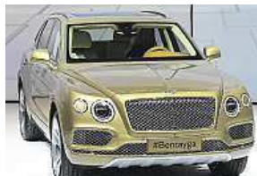
SUV od Bentleye

Má jít o nejvýkonnější terénní vůz s maximální rychlostí 301 km/h.