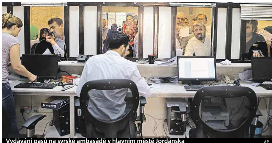
Vydávání pasů na syrské ambasádě v hlavním městě Jordánska

Lidé, kteří utíkají před boji v Sýrii, mohou opět získat pasy. Jsou však předražené a čeká se na ně aspoň měsíc.