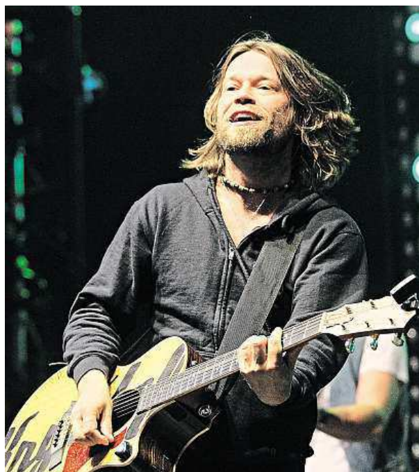
Vloni zahrála na festivalu i kapela Kryštof.

Pro účastníky festivalu budou přichystané i zpestřené prohlídky návštěvnické trasy Pilsner Urquell. Speciální okruh je zavede do bednární Prazdroje, kterou zpřístupňuje veřejnosti vždy jen v den festivalu. ZDENĚK SOUKUP