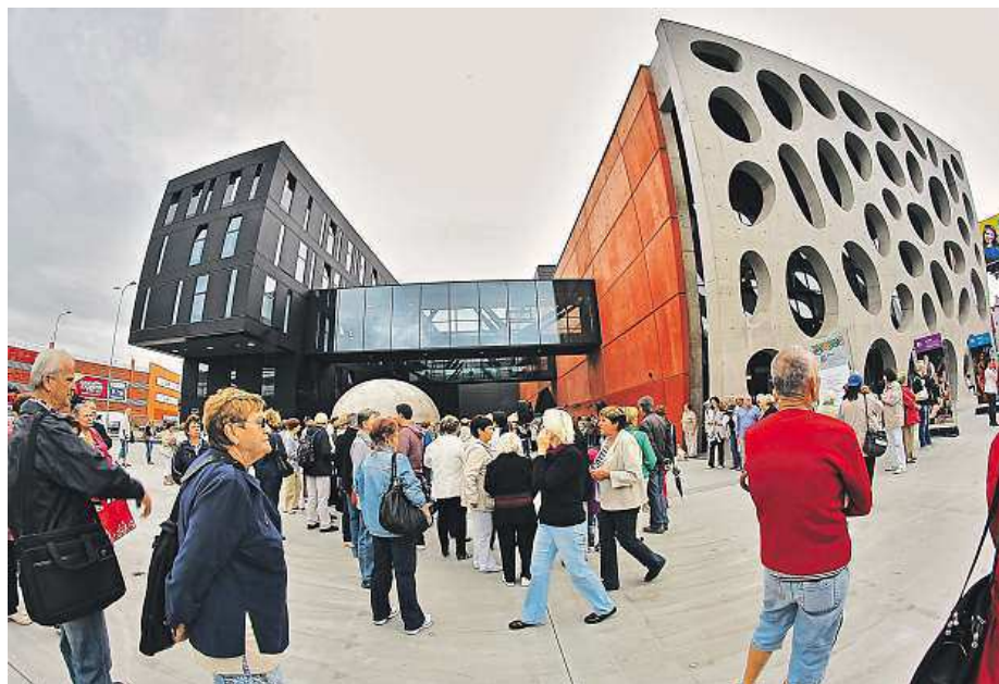
Součástí slavnostního otevření byl 2. září také průvod Vendelín.

Kompletní program v obou budovách najdete na www.djkt-plzen.cz/program . ZDENĚK SOUKUP