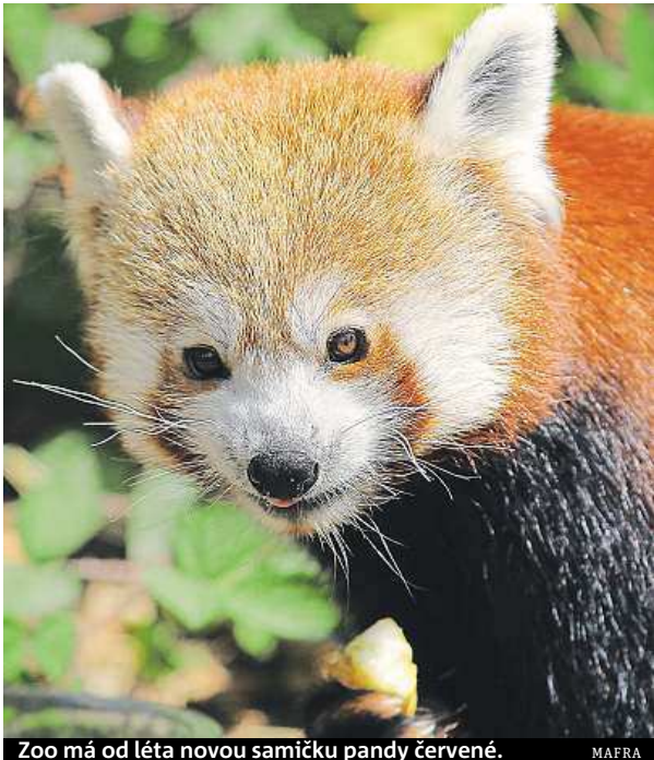
Zoo má od léta novou samičku pandy červené.

Kromě botanické zahrady jsou v kraji také arboreta – například Americká zahrada u Chudenic na Klatovsku založená v roce 1828. Obsahuje údajně nejucelenější soubor dřevin z území Severní Ameriky v ČR, a to včetně jednoho ze dvou nejstarších jedinců douglasky tisolisté na ev-