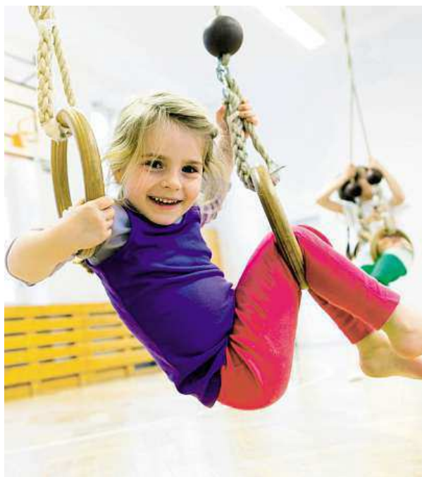
V nabídce je třeba i gymnastika.

Pro letošek přichystali ve Stanici mladých techniků pro zájemce i řadu novinek. „Například deskové hry, to je