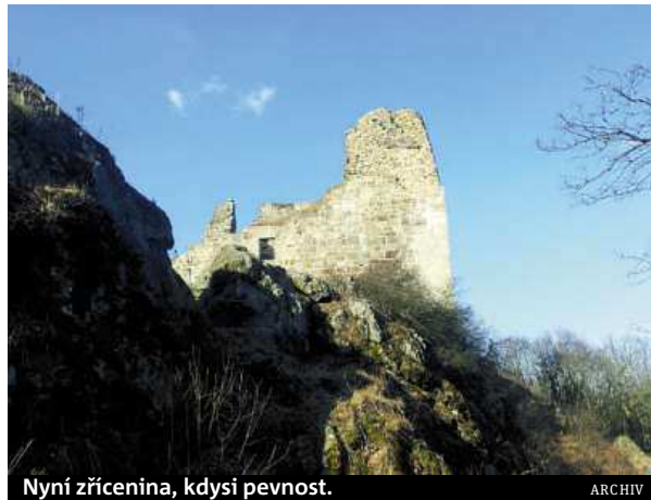
Nyní zřícenina, kdysi pevnost.

První zmínka o Přimdě je už z roku 1121, po Pražském hradu je tak považován za druhý nejstarší hrad v Česku. „Hrad nechal vystavět s největší pravděpodobností německý markrabě Děpolt II. z Vohburgu, ale nejspíše od roku 1126 patřila Přimda již českým panovníkům. Sloužila jako důležitá pohraniční pevnost, která střežila ob-