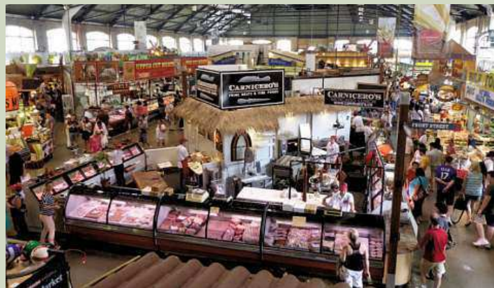
Farmářská tržnice v centru města chybí. Ta, kterou jí mají v Budapešti, láká na první pohled.

* Na obvodech budeme dbát, aby se peníze z úklidů nešetřily a nepřeváděly na jiné účely (důležitější než propagace a společenské či kulturní akce je posekaná tráva a uklizený chodník).