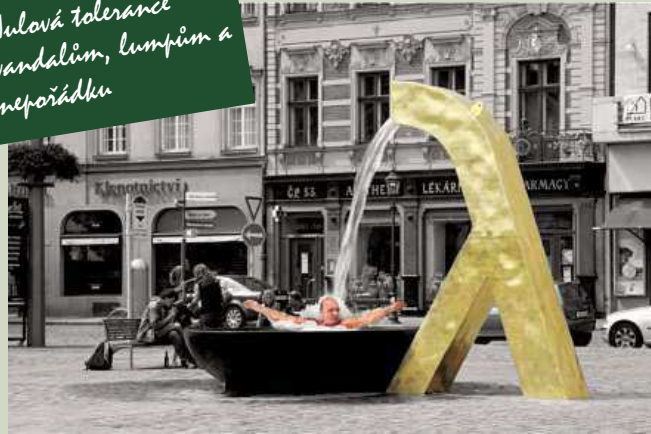
Jen diktátoři a plzeňští bezdomovci mají v koupelně zlato.

Nulová tolerance vandálům, lumpům a nepořádku