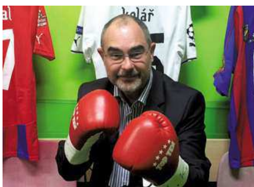
Kandidát na primátora Martin Zrzavecký na konci prázdnin otvíral Muzeum sportu v Plzni na Lochotíně.

rekonstrukce Městské sportovní haly na Slovanech. Řada projektů byla úspěšných i v oblasti sociálních služeb, zlepšování služeb MHD či podpory kultury a volnočasových aktivit obyvatel Plzně. Je toho samozřejmě mnohem více, ale pro mě je teď asi nejdůležitější, že se nám podaří vrátit vodárnu do vlastnictví města a zajistit tak regulovanou cenu vody.