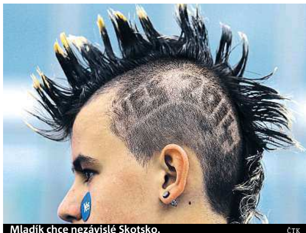
Mladík chce nezávislé Skotsko.

Základním předpokladem pro nezávislost jakéhokoli regionu je ekonomická soběstačnost. A ani v tomto