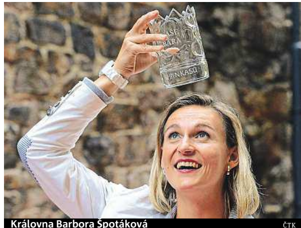
Královna Barbora Špotáková

Důvodem, proč se světové rekordmance na tradiční soustředění oštěpařů nechce, je právě rodina. „Dostavujeme