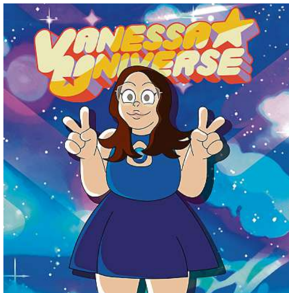
Podle Jandové projekt představuje fantastickou příležitost spojit zábavu s uměním a získat tak jedinečné a osobní dílo. T. JANDOVÁ

Kromě lidí dokáže do animovaného seriálu přenést například zvířata. Může to být nejen fajn tip na dárek, ale také originální dekorace do interiéru. „Služba představuje fantastickou příležitost spojit zábavu s uměním a získat tak jedinečné a osobní dílo,“ dodává Jandová. I když je pro ni stále neuvěřitelné, že vyhrála, věří, že její úspěch je odrazem vášně pro kreativitu a umění. „Mož-