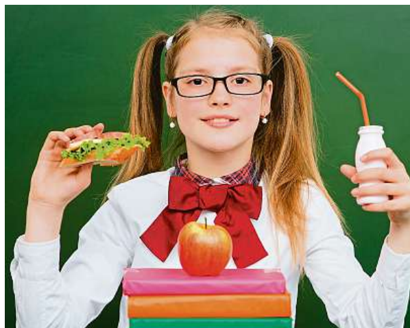
Tip odborníků na zdravou svačinu: jeden bílý jogurt, 100 g hroznové vína, jablko se sýrem cottage a neperlivá voda

Ideálně by dítě mělo přes den sníst pět až šest porcí v rozestupu maximálně tří hodin. Přitom jedním z nejdůležitějších denních jídel školáka je právě dopolední svačina. Ta slouží nejen k doplnění potřebné energie, ale také