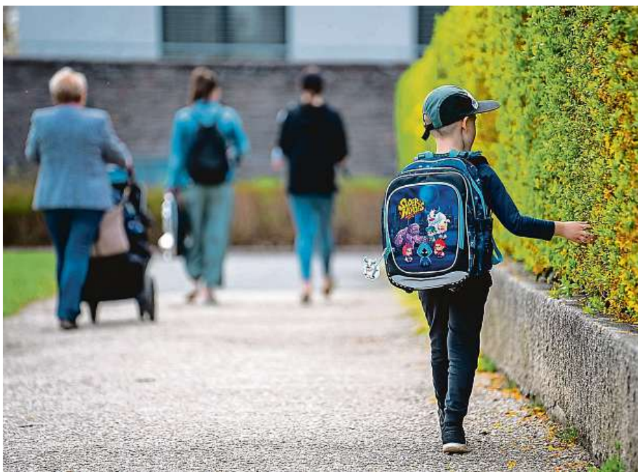
Děti mají batohy na zádech v podstatě každý den od školky až do puberty.

Zdravá záda dětí jsou prioritou Nástup do školy je obdobím, kdy se zásadně zhoršuje drž-