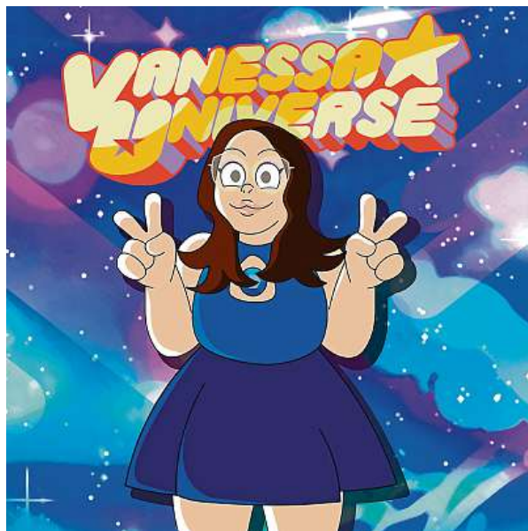
Podle Jandové projekt představuje fantastickou příležitost spojit zábavu s uměním a získat tak jedinečné a osobní dílo. T. JANDOVÁ

Kromě lidí dokáže do animovaného seriálu přenést například zvířata. Může to být nejen fajn tip na dárek, ale také originální dekorace do interiéru. „Služba představuje fantastickou příležitost spojit zábavu s uměním a získat tak jedinečné a osobní dílo,“ dodává Jandová. I když je pro ni stále neuvěřitelné, že vyhrála, věří, že její úspěch je odrazem vášně pro kreativitu a umění. „Mož-