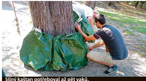
Silný kaštan potřeboval až pět vaků.

Tento systém však není jediný, jaký se na zavlažování používá. Často se při sázení městské zeleně do země instalují i takzvané husí krky. Tedy plastové trubky, které mají vodu vést až přímo ke kořenům. Dávají se hlavně ke stromům v centrech měst, kde není kolem kmene dostatek půdy, ale například betonové chodníky. Tyto roury ale často lákají vandaly a hlodavce. Myši se v nich usídlují a lidé do nich odkládají odpadky. MAREK HÝŘ