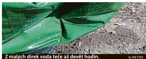
Z malých dírek voda teče až devět hodin.