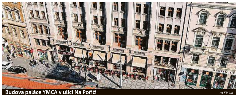
Budova paláce YMCA v ulici Na Poříčí