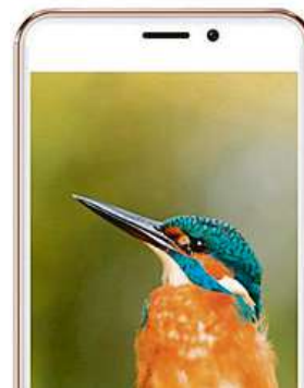
Aligator S5070 Duo 16GB

Na první pohled vás zaujme 5" IPS displej s HD rozlišením. Srdcem telefonu je čtyřjádrový procesor MediaTek MT6580 s frekvencí 1,3 GHz a 1 GB operační paměti. Tato kombinace je plně dostačující pro základní úkony v operačním systému Android 7.0. Pro vaše data poslouží interní úložiště o velikosti 16 GB, které je možné rozšířit micro SD kartou až o 128 GB. Potěší také oblíbené