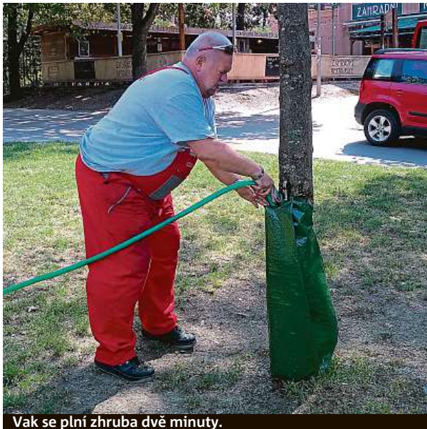
Vak se plní zhruba dvě minuty.

O zeleň se v Praze 5 stará společnost Centra. Ta vaky osazuje podle harmonogramu a zároveň zavlažuje stromky, které „napít“ viditelně potřebují. „Naplnit jeden vak zabere zhruba dvě minuty, v ideálním případě jeden strom zavlažujeme dva dny po sobě,“ popisuje systém pracovník společnosti