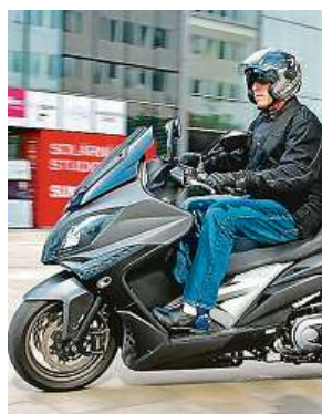
Skútr je v oblíbě.