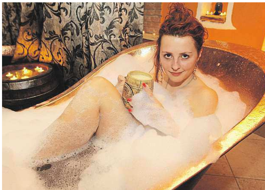
Blahodárné pivní koupele