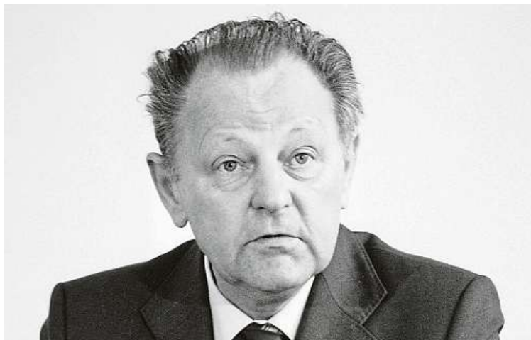
Hvězdně trapné chvíle Miloše (křtěného Milouš) Jakeše přišly před 35 lety.

Léto 1989 v socialistickém Československu nemělo chybu. Na kazetách se jako epidemie šířila nahrávka, na které blekotá šéf komunistů Miloš Jakeš.