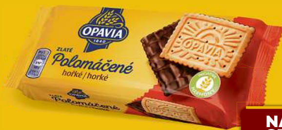
Opavia Zlaté Polomáčené 100 g, 2 druhy

Studio totiž v tichosti vyplatilo ušlý zisk pouze Dwaynu Johnsonovi, Emily Blunt, jež měla brát i bez ušlých peněz o půlku méně než její herecký kolega, měla ovšem přijít zkrátka. Nepřišla. I ona se ozvala a studio se s ní, ve větší tichosti než s kolegyní Johansson, rovněž mimosoudně vyrovnalo. FILIP JAROŠEVSKÝ