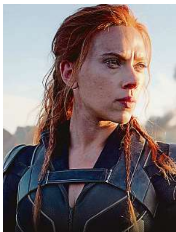
Scarlett Johansson je nejen herečka, ale i velice vlivná producentka.