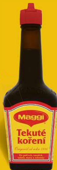
Maggi Tekuté koření 160 ml 100 ml = 15,57 Kč