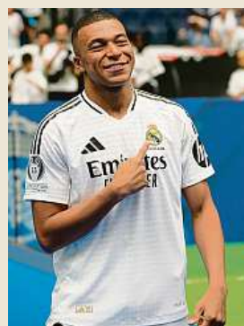
Už v dresu Realu Madrid

Francouzský fotbalista Kylian Mbappé si splnil dětský sen. Při oficiálním představení fanouškům včera oblékl na zaplněném stadionu Santiaga Bernabeua poprvé dres Realu Madrid. Uvítací slavnost na počest pětadvacetileté posily sledovalo v ochozech podle informací médií takřka 80 tisíc příznivců Bílého baletu. ČTK