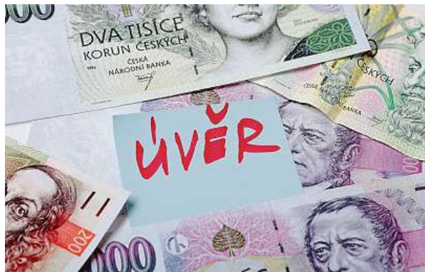
To, s čím máme stále potíže, je vypočítat přesně, jaký úrok z půjčené částky doopravdy zaplatíme, kolik nás bude reálně stát peněz. MAFRA

Z přehledu, který každoročně zpracovává Česká bankovní asociace (ČBA), totiž vyplývá, že šest z deseti lidí si odkládá pravidelně nějakou částku na horší časy a nečekané finanční „příhody.“ Průměrná částka na osobu a měsíc je 2500 korun. „Polovina lidí si ukládá i peníze na stáří, začínají tak kolem 45. roku,“ uvádí zpráva ČBA.