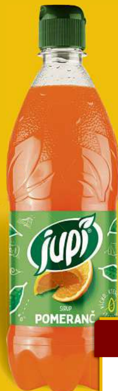
Jupí Sirup 0,7 l více druhů 1 l = 55,57 Kč