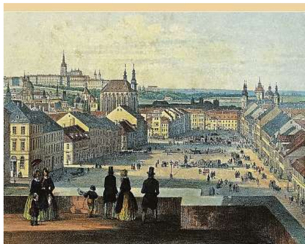
Václavské náměstí od východu z Koňské brány, asi rok 1850.

Středem náměstí tekla Vinohradský potok, který v dřívě-