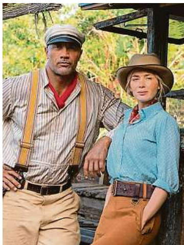
Dvě hlavní role, ale různé platy. Dwayne Johnson a Emily Blunt si nebyli rovni.

podporu talentů ze strany odborných institucí. Pouze dvacet osm procent z nich se domnívá, že podpora mladých lidí, kteří se snaží vybudovat úspěšnou filmovou kariéru, je dostatečná,“ tvrdí průzkum.