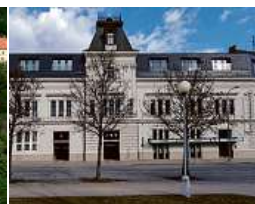
EFI SPA Hotel**** Superior & Pivovar