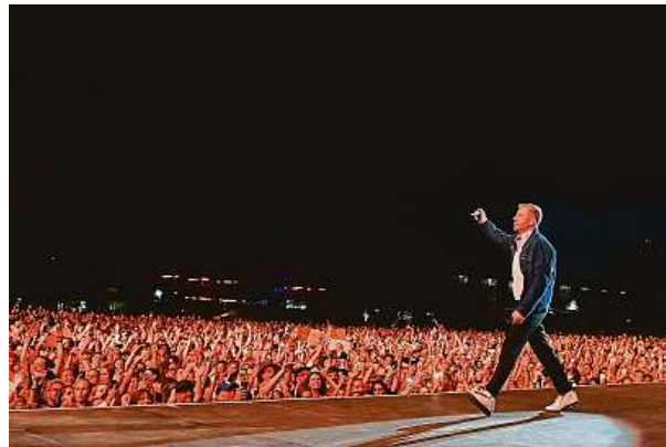
Loni na festivalu vystoupil například Macklemore (na snímku). Letos se zde objeví Lenny Kravitz či zpěvačka Zara Larsson.