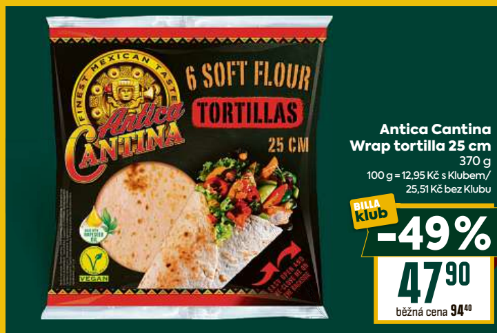
Antica Cantina Wrap tortilla 25 cm 370 g 100 g = 12,95 Kč s Klubem/ 25,51 Kč bez Klubu