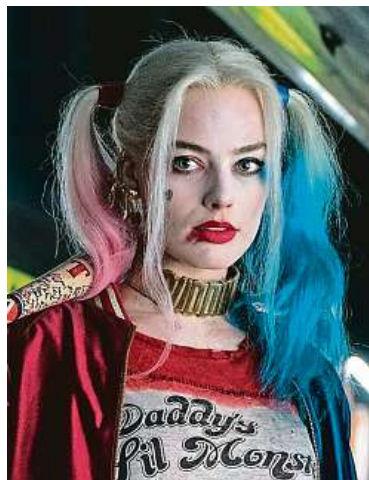
Margot Robbie loni vydělala 59 milionů dolarů. Je nejúspěšnější herečkou.