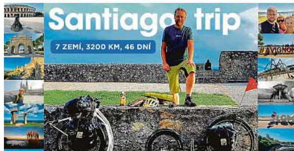
Do Santiaga de Compostela dorazil po šesti týdnech a 3200 kilometrech. Koloběžkový dobrodruh na cestě nezažil jediný nepříjemný zážitek. Snad jen dvakrát píchlé kolo a čtyřdenní déšť ve Švýcarsku. 2x YEDOO

Rychtar na svou větší cestu vyrazil v šestnácti, tenkrát se na kole vydal z rodné Volyně až do Hlubočce u Ostravy za Vítězslavem Dostálem – prvním Čechem, který na kole objel celý svět. „Pozval mě na čaj, potrásli jsme si rukama,