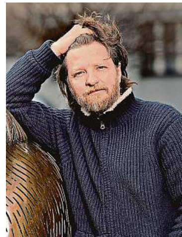
Rudolf Havlík je úspěšný český režisér. Na podzim jde do kin jeho Poklad.