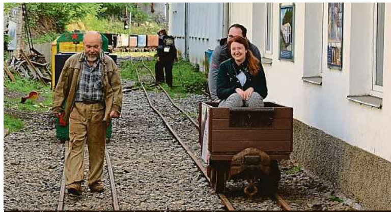
Návštěvníci se mohou svést v důlním vozíku.

Šachta není příliš známá, ale úplně skrytá před světem není. „Poslali nás sem z Národního technického muzea. Prý tu jsou zajímavé exponáty. Hodně šachtu vychvalovali,“ svěřil se jeden z nadšenců, který přišel důl prozkoumat. „Byli jsme v Solvayových lomech, odtamtud nás sem poslali. Doted jsme o dole v Chrustenických nevěděli, byla to škoda,“ sdělil jeden z návštěvníků. ANEŽKA VONDRÁKOVÁ