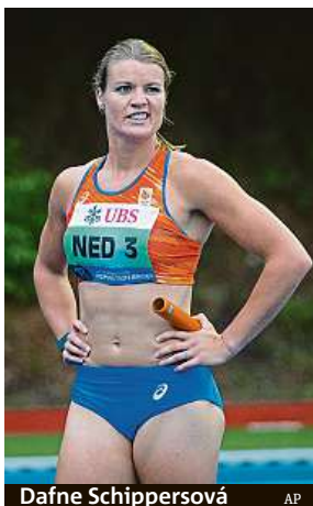
Dafne Schippersová

Vedle domácí špičky pořadatelé navzdory komplikované situaci počítají s účastí zahraničních hvězd. Po 24 le-