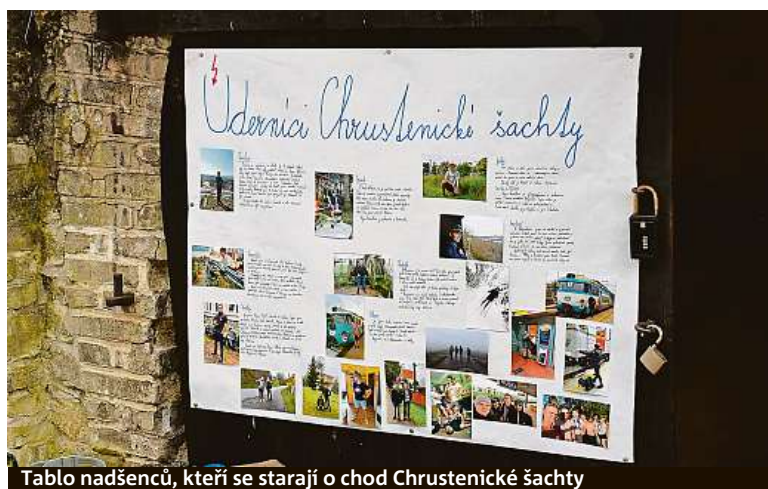
Tablo nadšenců, kteří se starají o chod Chrustenické šachty