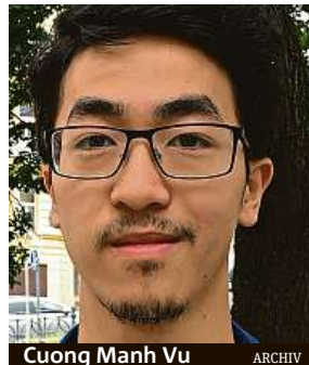
Cuong Manh Vu ARCHIV

Praha 3 vyhlásila další výzvu pro dalšího studující-