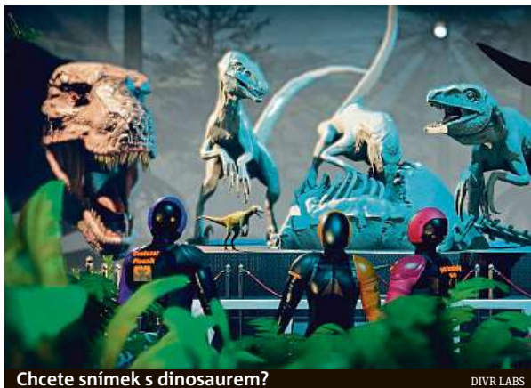
Chcete snímek s dinosaurem?

Účastníci mají hned od průchodu první bránou pocit, že se ocitají v úplně jiném světě. Virtuální hra Dinosauři VR se snaží hráčům přiblížit, jak asi mohl vypadat život před osmdesáti miliony lety, tedy v období druhohor. „Jedná se