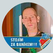
Jakub Antropius Nevěru beru jako zradu.