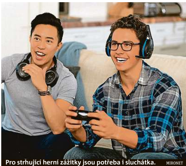
Pro strhující herní zážitky jsou potřeba i sluchátka. MIRONET

Patříte-li i vy mezi herní nadšence, kterým se dostává zmiňovaných žánrů, zpozorněte. Často opomíjenou součástí pro strhující herní zážitky jsou totiž kvalitní sluchátka, jež vás vtáhnou do děje, budou pohodlná i při dlouhých