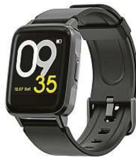
Haylou LS01 MIRONET

Hodinky Haylou LS01 doporučujeme pořídit v internetovém obchodě Mironet, kde je najdete za parádní cenu 890 korun.