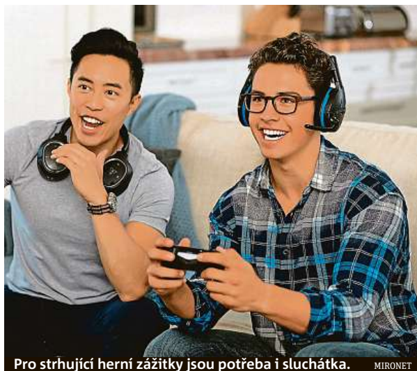
Pro strhující herní zážitky jsou potřeba i sluchátka.

Patříte-li i vy mezi herní nadšence, kterým se dostává zmiňovaných žánrů, zpozorněte. Často opomíjenou součástí pro strhující herní zážitky jsou totiž kvalitní sluchátka, jež vás vtáhnou do děje, budou pohodlná i při dlouhých