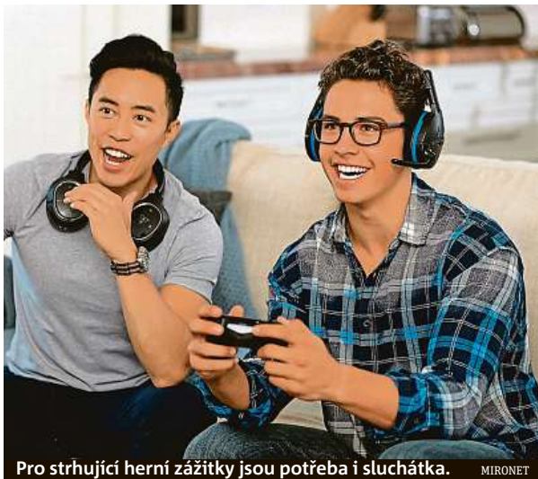
Pro strhující herní zážitky jsou potřeba i sluchátka. MIRONET

Poslední šance koupit sluchátka s dotací až 450 korun.