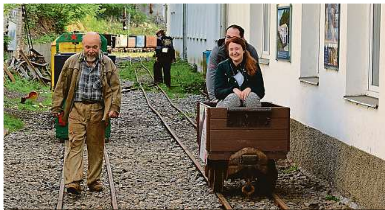
Návštěvníci se mohou svést v důlním vozíku.

Šachta není příliš známá, ale úplně skrytá před světem není. „Poslali nás sem z Národního technického muzea. Prý tu jsou zajímavé exponáty. Hodně šachtu vychvalovali,“ svěřil se jeden z nadšenců, který přišel důl prozkoumat. „Byli jsme v Solvayových lomech, odtamtud nás sem poslali. Doted jsme o dole v Chrustenické nevěděli, byla to škoda,“ sdělil jeden z návštěvníků. ANEŽKA VONDRÁKOVÁ