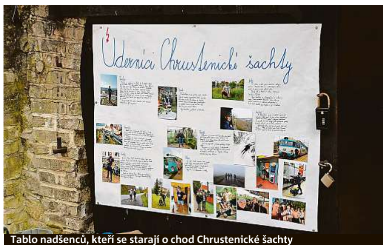
Tablo nadšenců, kteří se starají o chod Chrustenické šachty