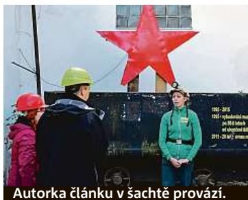
Autorka článku v šachtě provází.

šlo 28 horníků vyčistit stolu tři a razit chodby do vyšších pater. Těžba pokračovala do roku 1965. V roce 1997 jsme zde zřídili muzeum,“ říká správce dolu Miroslav Dobrý. Při návštěvě dolu nevidíte jen díru v zemi a pár exponátů. Můžete tu spatřit i funkční vzduchovou vrtačku na vzduchovém teleskopickém sloupu. S ní dokázali v době provozu vyrazit až sto metrů měsíčně. Další technikou, jež návštěvníky vždy zaujme, je vzduchový nakladač – důlní bagr. Tyto stroje většinou ovládají drobné dívky, které v kolektivu průvodců převažují. Zážitky z bagrování díky tomu dosahují zcela jiné úrovně. „Milovníci adrenalinu ocení fárání po osmimetrových žebřících. Celá prohlídka je zakončena jízdou důlním vláčkem, kterou si nejvíce užívají děti,“ dodává Dobrý.