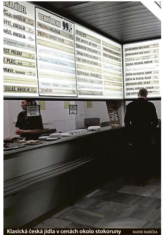
Klasická česká jídla v cenách okolo stokoruny