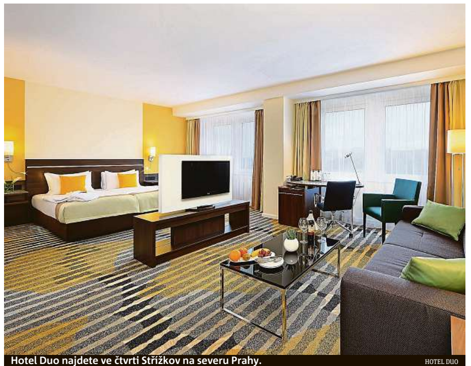
Hotel Duo najdete ve čtvrti Střížkov na severu Prahy.