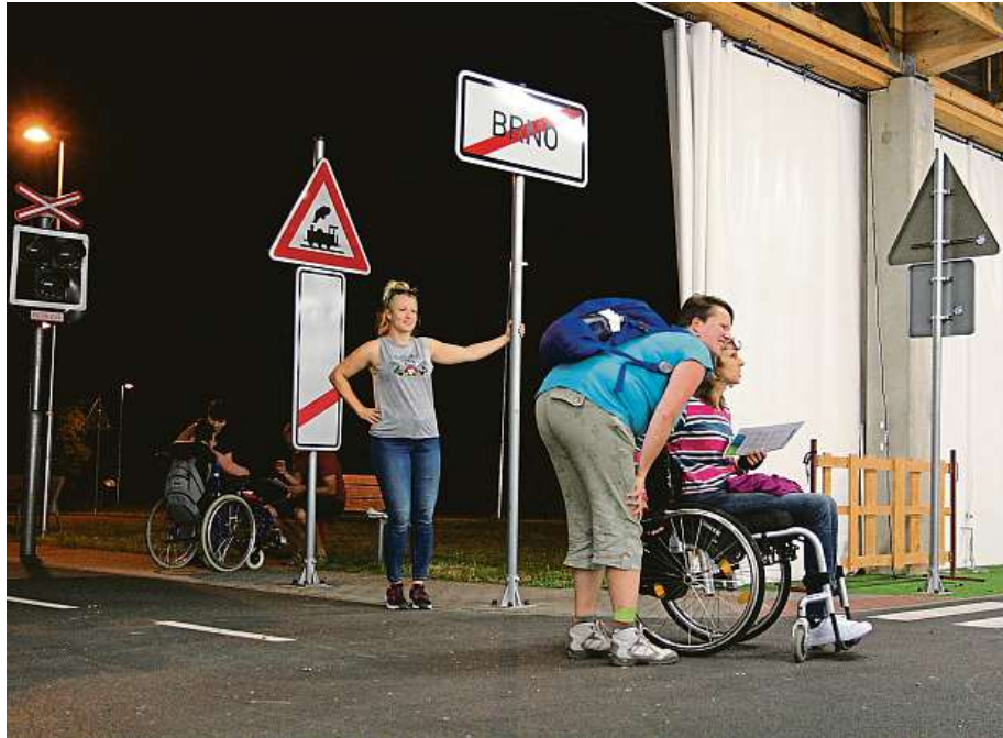
Součástí hry Temno byly také úkoly na dopravním hřišti.

Soutěžící se díky luštění šifer podívali na zajímavá místa. V rámci řešení šifry museli