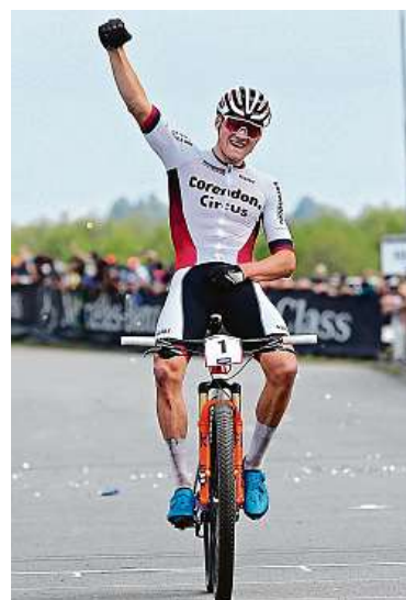
Mathieu van der Poel

Dobrou zprávou pro diváky a fanoušky je, že se vstupné po celou dobu šampionátu neplatí. BAB