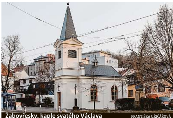
Žabovřesky, kaple svatého Václava