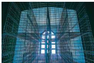
Výstava „Zpřítomnění místa: Petr Stanický“ na Špilberku.

Na Špilberku lidé uvidí Stanického aktuální tvorbu, ale i díla vytvořená speciálně pro Špilberk. „V hranolové věži jsou úzká onyxová okna, jimiž proniká světlo. Tento