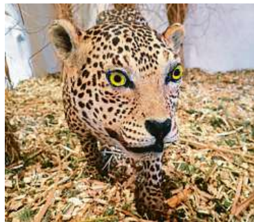
Výstavu doplňují exponáty ze zámku v Budišově na Třebíčsku. Nechybí ani levhart skvrnitý.

se věnuje část expozice věnovaná Úmluvě o mezinárodním obchodu s ohroženými druhy volně žijících živočichů a planě rostoucích rostlin (CITES). Ta se soustřeďuje na ochranu ohrožených druhů živočichů a rostlin před hrozbou vyhubení v přírodě z důvodu nadměrného využívání pro komerční účely.